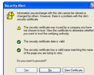
รูปที่ 2 IE6 warning

กรณีที่ไม่สามารถเข้าหน้าหลักของ I-Pass ได้ซึ่งจะพบกับหน้าจอคล้ายกับ error ซึ่งจะมีด้วยกันหลายรูปแบบ ในกรณีที่ เป็น Internet Explorer 6 และ Internet Explorer 7 จะปรากฏดังนี้