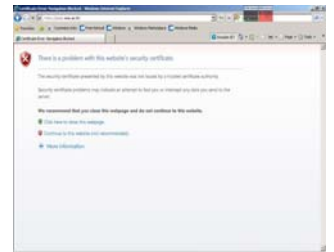
รูปที่ 3 IE7 warning

กรณีที่ เป็น IE 6 ให้ทำการกดปุ่ม Yes และ ในกรณีที่ เป็น IE 7 ให้ทำการเลือก Continue to this website (not recommended) แล้วจากนั้นเมื่อเข้าหน้าจอ I-Pass ได้แล้วก็ทำการติดตั้งในส่วนของการแก้ปัญหาเบื้องต้น และทำการคลิก ในส่วนของคลิกที่นี้ ในข้อ 1.1 และดำเนินการตามขั้นตอนที่ได้กล่าวมาในตอนต้น ต่อไปก็จะไม่ถามเตือนเกี่ยวกับ certificated อีกต่อไป