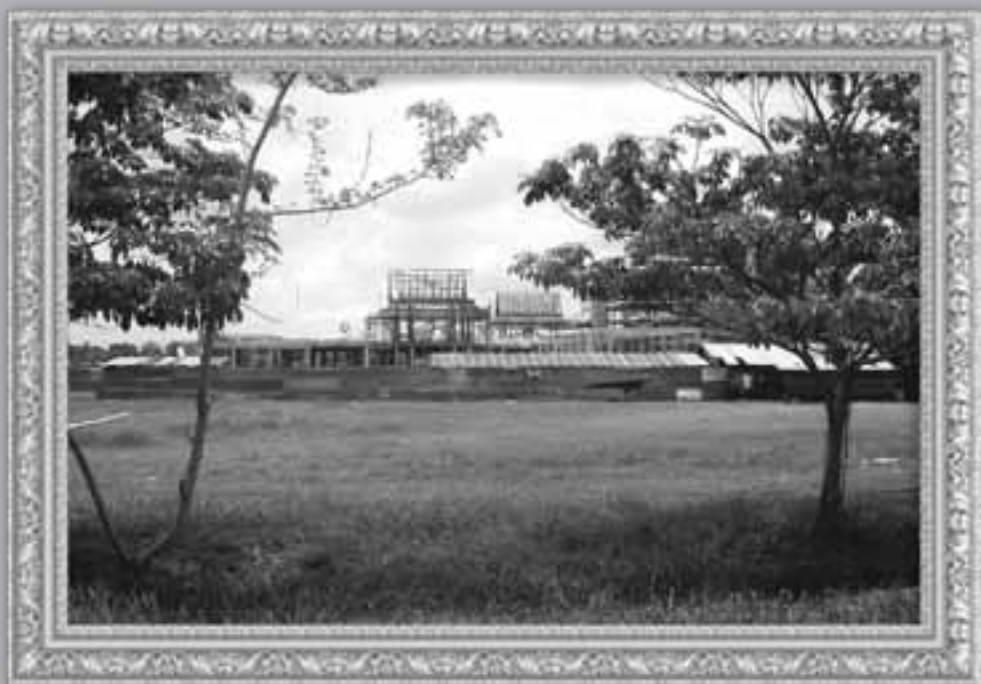
พิพิธภัณฑ์ภูมิปัญญาไทย มศว องค์กรักษ์