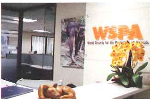
สำนักงานภูมิภาคเอเชีย

ปัจจุบัน WSPA มีกลุ่มสมาชิกในภูมิภาคเอเชีย กว่า 108 สมาชิก จาก 27 ประเทศ โดยในเมืองไทยมีกว่า 11 กลุ่มสมาชิก