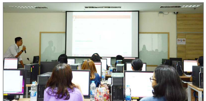
ภาพที่ 2 อบรมการใช้งานระบบ SWU-SAP ให้แก่นักวิเคราะห์นโยบายฯ ของหน่วยงาน ระหว่างวันที่ 20 - 21 สิงหาคม 2558

เปิดใช้งานอย่างเป็นทางการในเดือนกันยายน 2558