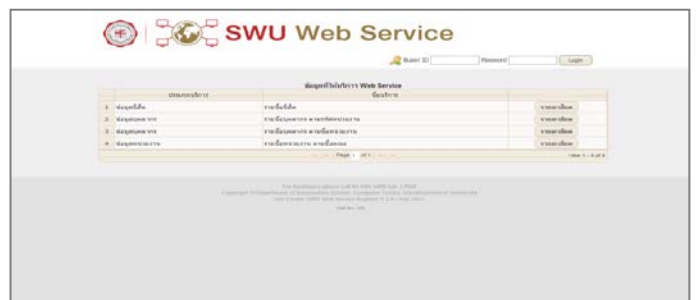
ภาพที่ 3 เว็บไซต์ระบบ SWU Web Service

ข้อมูลที่ได้รับจากระบบเป็นไฟล์รูปแบบ Excel และ XML