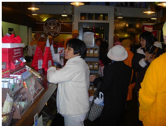
ร้านกาแฟ Starbucks