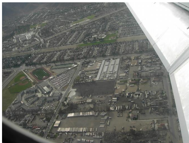
มองจากเครื่องบิน