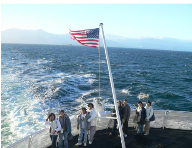
ที่หัวเรือ