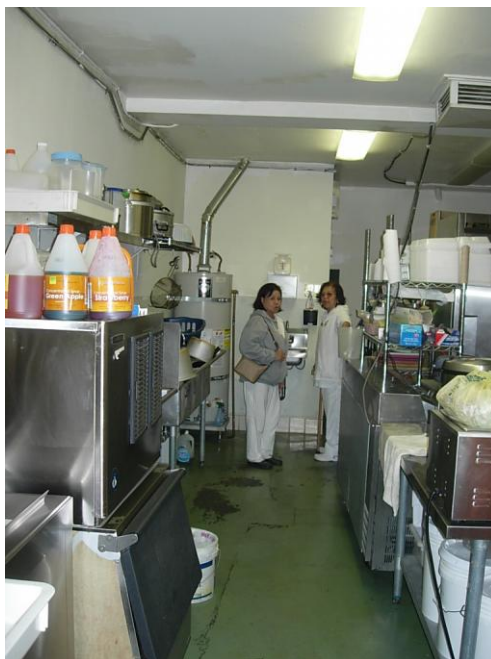
ห้องครัว