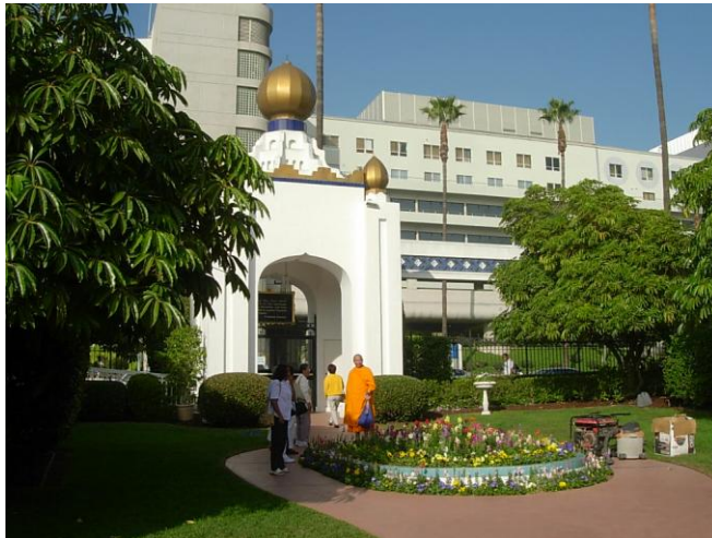
วัดอินเดีย

วันที่ ๑๘ พฤศจิกายน ๒๕๕๐ หลวงพี่พาไปชมวัดอินเดีย แล้วเลยไปดูรอยเท้าของคาราที่เมืองฮอลลีวูด แวะบ้านสาธุชนคนหนึ่ง รับเลี้ยงอาหารเย็นที่บ้านนี้ด้วย