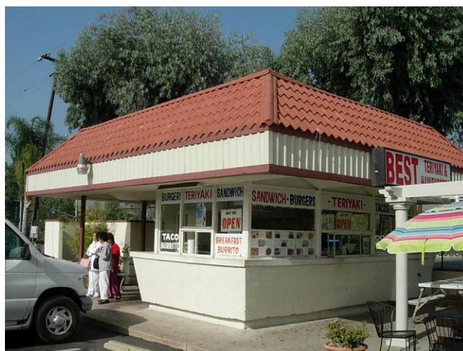
หน้าร้าน

วันที่ ๒๐ พฤศจิกายน ๒๕๕๐ ไปทานอาหารกลางวันที่ร้านของชุมชนคนหนึ่ง เป็นร้านขายอาหารประเภทจานด่วน เช่น แซมเบอร์เกอร์ แซนวิช ไก่ทอด มันทอด ฯลฯ