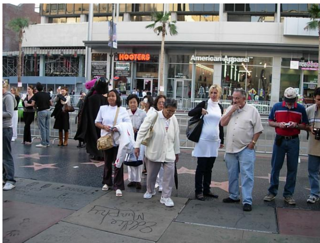
รอยเท้าของดารา