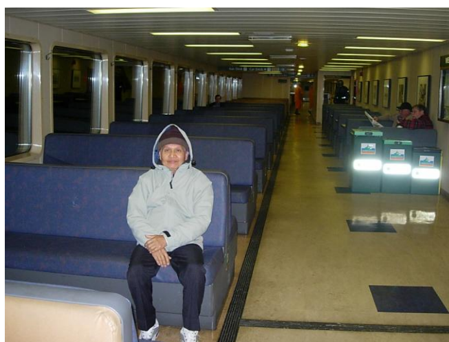
ภายในเรือมีคนโดยสารน้อยมากเพราะยังเช้า

วันที่ ๒๗ พฤศจิกายน ๒๕๕๐ คณะเดินทางไปแคนาดา ออกเดินทางโดยรถตู้ ๔ คันๆละ ๑๒ คน ออกเดินทางเวลา ๕.๓๐ น. ขับรถตู้ไปสักครู่ก็ถึงที่ซื้อตั๋วเพื่อขับรถเข้าไปในเรือขนาดใหญ่ และต้องจอดรอนกว่าเรือจะมาถึง เมื่อรถเข้าไปในเรือแล้ว พวกเราต้องลงจากรถตู้เข้าไปนั่งพักในห้องโดยสารขนาดใหญ่ เรือแล่นราว ๓๐ นาที ก็ขับรถตู้ออกจากเรือแล่นไปสักพักหนึ่งก็เข้าไปจอดในเรืออีกลำหนึ่ง เรือแล่นราว ๑ ชั่วโมง ๓๐ นาที รถแล่นออกจากเรือลำที่สอง ขับเข้าไปจอดในเรือลำที่สาม ราว ๑ ชั่วโมง ๓๐ นาที ก็ถึงท่าเรือเมืองวิกทอเรีย ประเทศแคนาดา รถตู้ผ่านด่านตรวจคนเข้าเมือง ต้องให้พาสปอร์ตไปประทับตรา พักที่ศูนย์ปฏิบัติการแนวเวอร์