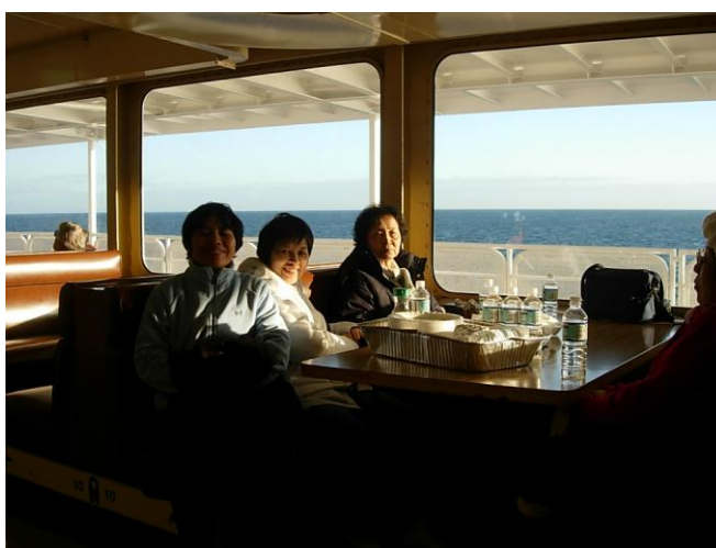
ภายในเรือ