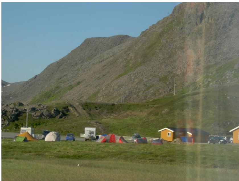
มองจากหน้าต่างโรงแรม

เวลา ๘.๐๔ น.ออกจากโรงแรม เพื่อเดินทางกลับเมืองเฮลซิงกิอีกครั้ง เทียวกลับมัทคุเทศก์ชี้ให้ดูฟยอร์ด (Aurlandfjord) ที่สวยงามซึ่งได้รับการขึ้นชื่อเป็นมรดกโลกจากยูเนสโก ฟยอร์ดเกิดจากธารน้ำแข็งที่กัดเซาะชายฝั่งแผ่นดินให้เป็นเว้าแหว่ง และเมื่อธารน้ำแข็งละลาย น้ำทะเลเข้ามาแทนที่กลายเป็นฟยอร์ด ชมพิพิธภัณฑ์ชาวขามิ