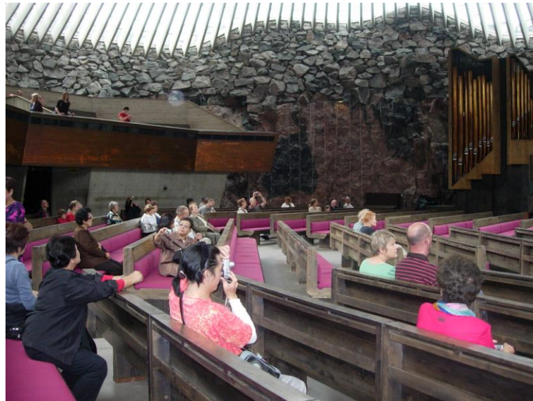
ภายใน โบสถ์หิน