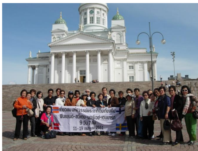
ถ่ายภาพร่วมกันหน้าโบสถ์ขาว