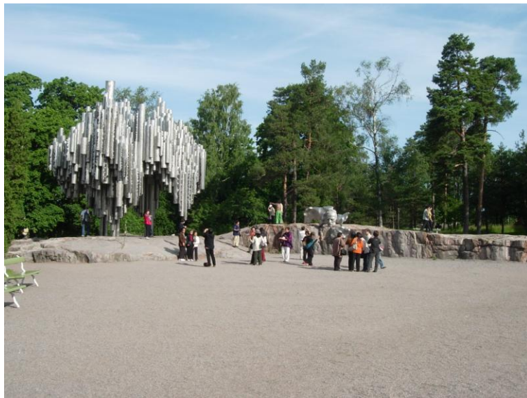
สวนสาธารณะ