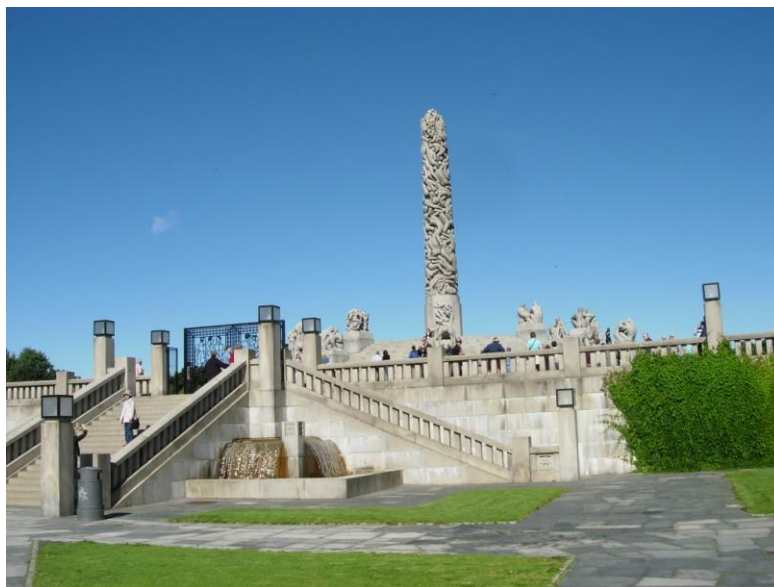
The Monolith หรือแท่งหินก้อนเดียว