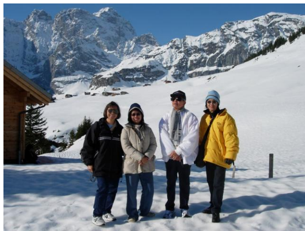
เที่ยวยุโรป โฉบไปอเมริกา