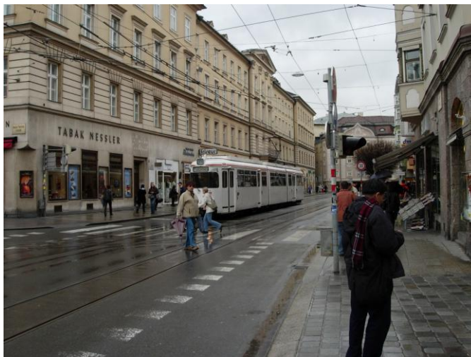
เมือง Salzburg : บ้านเกิดของโมสาร์ท

สถานที่ที่น่าสนใจของเมืองนี้มีมากพอสมควร เช่น มหาวิหารซึ่งสร้างเมื่อ ค.ศ.1628 วังที่ประทับของอาร์คบิชอป ปราสาทบนเชิงเขา (มีรถสายพานนำขึ้นไปสู่ปราสาทได้ด้วย) โบสถ์ บ้านเกิดของโมสาร์ท พิพิธภัณฑ์ ศาลาว่าการเมือง เป็นต้น และเมือง Salzburg ยังเป็นเมืองที่มีชื่อเสียงไปทั่วโลกจากการเป็นฉากในภาพยนตร์เรื่อง The Sound of Music อีกด้วย เรื่องจริงก็เกิดขึ้นที่เมืองนี้ โมสาร์ทซึ่งเป็นคีตกวีที่มีชื่อเสียงของโลกก็เกิดที่เมืองนี้ ยังมีบ้านเกิดของโมสาร์ทให้แวะชมได้ด้วย แต่ปัจจุบันเป็นพิพิธภัณฑ์ มีคนเดินผ่านไปมาก็แวะยืนดูป้ายบ้านของโมสาร์ทอยู่หนึ่ง พวกเราก็ได้แวะดูด้วย อาจารย์นักสัตวศาสตร์และปราสาทที่ตั้งอยู่บนเชิงเขา และเดินชมเมืองไปตามถนนรัชฎ์พีช ซึ่งเป็นถนนโบราณเคยขายรัชฎ์พีชมาก่อน ปัจจุบันเป็นถนนคนเดินมีร้านอาหารและสินค้าานาชนิดที่ราคาแพงมากสำหรับคนไทย