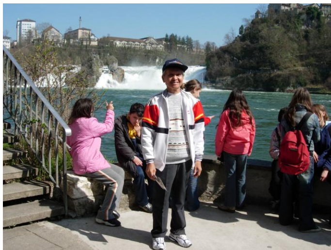
เบื้องหลังคือน้ำตก Rheinfall

แล้วเดินทางต่อไปแวะชมน้ำตก Rheinfall ซึ่งเป็นน้ำตกที่ใหญ่ที่สุดของยุโรป เกิดจากการที่แม่น้ำไรน์ซึ่งเป็นแม่น้ำนานาชาติที่ใหญ่ที่สุดของยุโรปไหลจากต้นน้ำในเทือกเขาแอลป์ มายังบริเวณที่พื้นที่โลกเปลี่ยนระดับจึงกลายเป็นน้ำตกที่สวยงามมาก ตัวน้ำตกสูง 25 เมตร กว้าง 150 เมตร มีอายุราว 14,000 – 17,000 ปี พวกเราเดินดูและถ่ายรูปไกลจากตัวน้ำตกพอสมควร เพราะถ้าเดินไปใกล้ๆน้ำตกจะเสียเวลามาก แต่ก็ได้เห็นน้ำตกที่สวยงามมาก