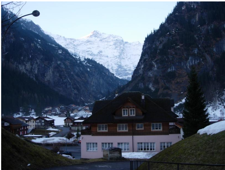
เมืองในหุบเขา Unterschachen

พวกเราถึงที่พักเป็นโรงแรมในหุบเขา Unterschachen ชื่อ Hotel Alpina เป็นอาคารสามชั้น มองเห็นภูเขาและหิมะรอบทุกทิศทีเดียว บ้านเรือนก็มีหิมะบนหลังคา รวมทั้งสนามหญ้าก็มีหิมะเช่นกัน พวกเรารับประทานอาหารเย็นในโรงแรม ซึ่งเป็นอาหารฝรั่งจานเดียว มีไก่และหมูให้เลือก ถ้าใครทานไม่อิ่มเขาก็เติมให้