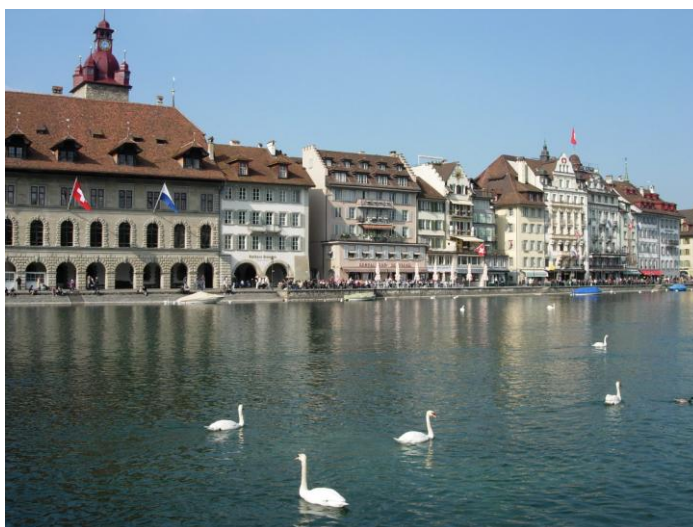
อาคารสถาปัตยกรรมทางประวัติศาสตร์ในเมืองลูเซิร์น (Lucerne)

แล้วเดินทางกลับไปพักที่ Hotel Alpina ในหุบเขา Unterschachen อีกหนึ่งคืน