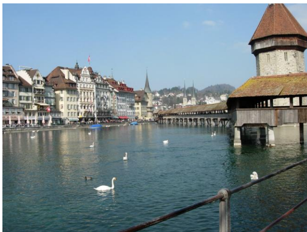
สะพานชาเปล (Chapel Bridge)

ขายของที่ระลึก นอกจากนี้ยังมีอาคารสถาปัตยกรรมทางประวัติศาสตร์หลายแห่ง เช่น โบสถ์เยชูอิตเก่าเป็นศิลปะแบบบาโรก พิพิธภัณฑ์การคมนาคม และท้องฟ้าจำลอง เป็นต้น