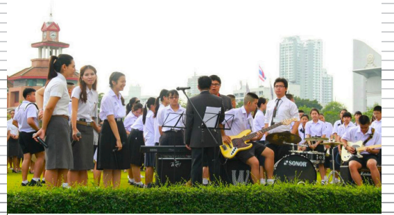
หนึ่งบรรยากาศ 'พลังร่วม' แห่งความสุข ในความเป็น 'มหาวิทยาลัยศรีนครินทรวิโรฒ'