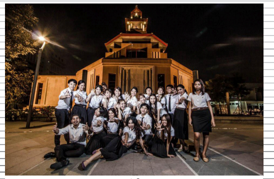
ภาพความประทับใจของนิสิต มศว

วันจันทร์ที่ 14 มกราคม 2556 ปีที่ 7 ฉบับที่ 278