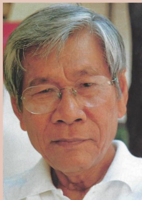
“ผมเป็นครุศิลป์ ผมไม่ใช่ศิลปิน”

มหาวิทยาลัย มศว องค์กรฯ ซึ่งเปรียบเสมือนบ้านหลังที่สอง หากบ้านของเราชำรุดหรือมีเรื่องที่ต้องแก้ไขปรับปรุง เจ้าของบ้านหรือสมาชิกภายในบ้านจะสะท้อนปัญหาได้เป็นอย่างดีและเข้าใจปัญหาต่างๆ ได้มากกว่าคนอื่นฯ นอกจากนี้การฟังนิสิตนำเสนอปัญหาในหลายๆ เรื่องไม่ว่าจะเป็นเรื่องห้องเรียน พื้นที่รอบๆ มหาวิทยาลัย ห้องน้ำ หอพัก อาคารเรียนรวมที่นิสิตทุกคนต้องไปเรียนวิชาพื้นฐานที่อาคารนี้ การใช้งานพื้นที่ในอาคารจำเป็นต้องมีการปรับปรุงแก้ไข เพื่อยกระดับคุณภาพชีวิตของนิสิต อาจารย์ผู้สอน ซึ่งก็หมายถึงคุณภาพการเรียนของนิสิต มศว องค์กรฯ จะเกิดคุณภาพ เพราะอย่าลืมว่าสิ่งแวดล้อมมีผลต่อการเรียนรู้ของผู้เรียน การจัดบรรยากาศทั้งห้องเรียน (อ่านต่อหน้า 2)