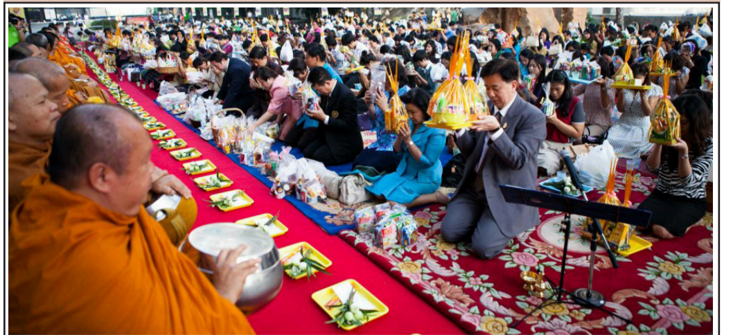
▲ ชาว มศว ร่วมตักบาตรถวายแด่พระสงฆ์ จำนวน 57 รูป เนื่องในโอกาสวันขึ้นปีใหม่ พุทธศักราช 2556 เมื่อวันที่ 26 ธันวาคม 2556 ณ ลานสวนนันทน์ ถนนอโศกมนตรี มศว ประสานมิตร