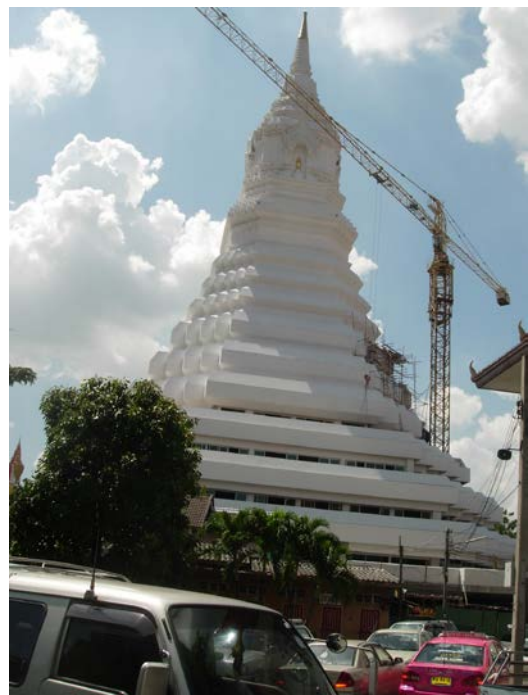
พระมหาเจดีย์มหารัชมงคลที่สร้างเสร็จแล้ว

สิ่งที่น่าสนใจอีกสิ่งหนึ่งคือ ธรรมาสถูปไม้จำหลัก ซึ่งเป็นของโบราณสมัยอยุธยาตอนกลาง ได้รับการยกย่องเป็นงานจำหลักไม้ชิ้นยอดเยี่ยม ปัจจุบันเก็บรักษาและอนุรักษ์ไว้ที่ศาลาการเปรียญ ชั้นบน