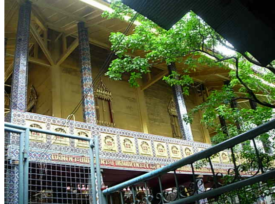
หอไตรกลางน้ำ

หอไตรกลางน้ำ อยู่ข้างพระอุโบสถ เป็นหอไตรเก่าได้รับการบูรณะปฏิสังขรณ์ใหม่เมื่อปี พ.ศ. ๒๕๒๕ โดยถอดหลังคาและไม้ออกทีละชั้น พบว่าไม้หมดสภาพแล้ว ทางวัดจึงรื้อทำใหม่ทั้งหมด ถอดแบบเก่าของเดิม ทำลวดลายเหมือนเดิม ฝาผนังด้านนอกลงรักปิดทองทึบทั้งหลัง ส่วนด้านในเขียนภาพ บนฝาเพดานทั้งด้านในและด้านนอกปิดทองทึบ เสาทุกต้นติดกระຈกประดับลาย และจารึกอักษรไว้ด้านนอกทางได้ว่า “เฉลิมพระเกียรติพระบาทสมเด็จพระเจ้าอยู่หัวภูมิพลอดุลยเดช องค์เอกอัครศาสนูปถัมภก พระชนมพรรษา ๕ รอบ ๕ ธันวาคม ๒๕๓๐” แต่ปัจจุบันพบว่าฝาผนังด้านนอกของหอไตรที่ลงรักปิดทองทึบนั้นยังมองเห็นคล้ายๆ เป็นจิตรกรรมฝาผนัง เข้าใจว่าเดิมอาจมีจิตรกรรมฝาผนังก็ได้ ส่วนสระน้ำที่หอไตรตั้งอยู่นั้นเข้าใจว่าเดิมคงกว้างใหญ่กว่าสภาพปัจจุบัน และมีน้ำในสระน้อยลงมาก หอระฆังมี ๒ หลัง หลังเดิมเป็นของโบราณคู่มากับวัด มีลวดลายปูนปั้นศิลปะสมัยอยุธยา ยอดทำเป็นทรงแหลมคล้ายเจดีย์ ส่วนอีกหลังหนึ่งสร้างขึ้นใหม่ ศาลาท่าน้ำ มีศาลาท่าน้ำหลายหลังทั้งที่ริมคลองบกกอกใหญ่และคลองด่าน สวนกาญจนาภิเษก สร้างเมื่อปี พ.ศ. ๒๕๓๕ อยู่ริมคลองบางกอกใหญ่ มีต้นไม้ร่มรื่นและก้อนหินประดับขนาดใหญ่