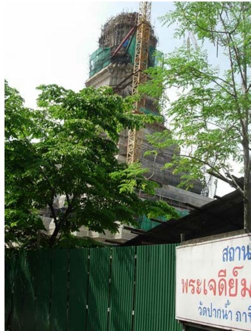
พระมหาเจดีย์มหารัชมงคลที่กำลังก่อสร้าง