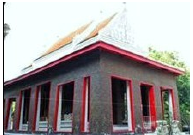
วิหารพระบาง

โบราณวัตถุสถาน ที่น่าสนใจน่าศึกษา คือ พระอุโบสถ มีพระประธานเป็นพระหล่อปางมารวิชัย พระวิหาร ๓ หลังๆหนึ่งมีพระพุทธรูปไสยาสน์ยาว ๔.๕๕ เมตร ศาลาการเปรียญ ๒ หลัง มณฑป