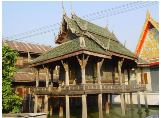
พระอุโบสถ หอไตรกลางน้ำ วัดอัปสรสวรรค์วิหาร

จาก วัดอัปสรสวรรค์วิหาร มีสะพานข้ามคลองด่านไปยัง วัดขุนจันทร์ ได้ วัดขุนจันทร์นี้อยู่คนละฟากคลองกับ วัดอัปสรสวรรค์วิหาร กล่าวกันว่าวัดขุนจันทร์เป็นวัดเก่ามีมาแต่ครั้งกรุงศรีอยุธยา และมีการปฏิสังขรณ์ครั้งใหญ่ในสมัยรัชกาลที่ ๓ มีโบราณสถานที่น่าสนใจ เช่น วิหารหลวงพ่อโต มีพระพุทธรูปองค์ใหญ่ เรียกกันว่า “หลวงพ่อโต” ประดิษฐานอยู่ เดิมเป็นพระพุทธรูปปูนปั้น ก่ออิฐแกนไม้สมัยอยุธยา แต่ถูกทุบทิ้งแล้วสร้างขึ้นใหม่ และมีธรรมาสันสลักไม้อยู่ในวิหารนี้ด้วย พระอุโบสถ ประดับกระจกทั้งหลัง นอกจากนี้ยังมี วิหารเจ้าแม่กวนอิม วิหารหลวงพ่อยก อาคาร ๕ ชั้น และ ศาลาท่าน้ำ เป็นต้น