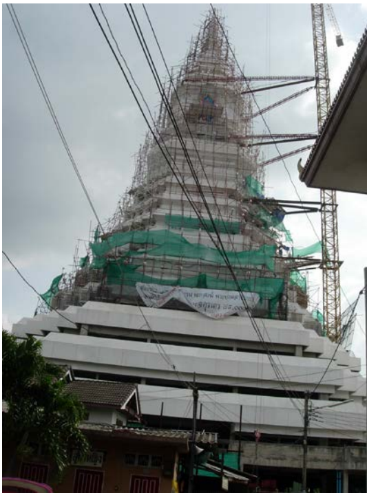
พระมหาเจดีย์มหารัชมงคลที่กำลังก่อสร้าง