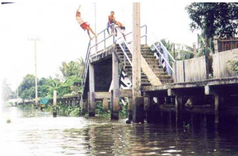
คลองภาษีเจริญ

เป็นคลองที่เริ่มจากคลองบางกอกใหญ่ที่วัดปากน้ำภาษีเจริญไปออกแม่น้ำท่าจีนที่ตำบลดอนไถ่ดี อำเภอรามัญแบน จังหวัดสมุทรสาคร ยาว ๒๔ กิโลเมตร รัชกาลที่ ๔ โปรดเกล้าฯให้ขุดคลองนี้ขึ้น แล้วเสร็จในสมัยรัชกาลที่ ๕ เมื่อปี พ.ศ. ๒๔๑๕ เป็นคลองที่หลวงพ่อกงจะใช้เป็นเส้นทางเดินอีกเส้นทางหนึ่งจากอำเภอสองพี่น้องมาตามแม่น้ำท่าจีนแล้วเข้าคลองภาษีเจริญมาวัดปากน้ำ ภาษีเจริญ หรือมาค้าข้าวที่กรุงเทพฯ หรือมาศึกษาพระปริยัติธรรมที่กรุงเทพฯก็ได้