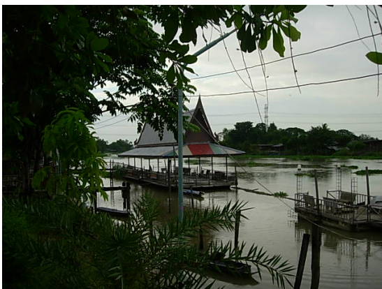
แม่น้ำนครชัยศรี หน้าวัดบางปลา

มีวัดที่หลวงปู่เคยไปเรียนหนังสือและสอนวิชาธรรมกายคือ วัดบางปลา ก็ตั้งอยูริมคลองนี้ ดังนั้นการเดินทางไปวัดบางปลา หลวงปู่คงไปทางเรือตามแม่น้ำท่าจีนนี้แน่นอน