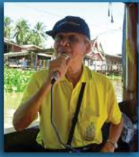
เส้นทางมหาปูชนียจารย์ พระมงคลเทพมุนี (สด จนฺทสโร)