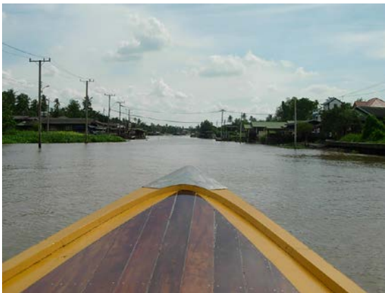
ช่วงที่แยกจากแม่น้ำเจ้าพระยา ณตำบลไทรม้า

เป็นคลองที่หลวงพ่อใช้เดินทางจากบ้านเกิดไปค้าข้าวในกรุงเทพฯ และเดินทางไป กรุงเทพฯ เพื่อศึกษาพระปริยัติธรรมที่วัดพระเชตุพนวิมลมังคลาราม