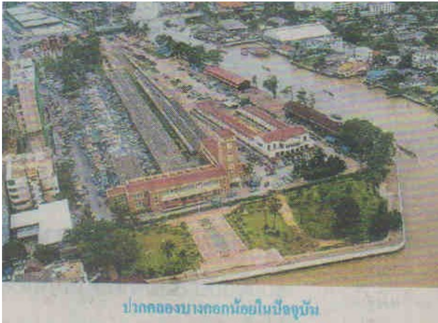
คลองบางกอกน้อยออกแม่น้ำเจ้าพระยาที่ข้างสถานีรถไฟบางกอกน้อย

ตะวันตก แล้ววกลงทางใต้ ไปจดคลองบางกรวย (ช่วงนี้เรียกคลองบางกรวย) แล้วออกแม่น้ำเจ้าพระยาในท้องที่อำเภอบางกรวย ยาว ๑๗.๕ ก.ม. สำหรับคลองบางกอกน้อยนี้ ได้แบ่งช่วงของคลองบางกอกน้อย คือจากแม่น้ำเจ้าพระยาเข้ามาจนถึงคลองบางรักใหญ่ เรียกว่า "คลองอ้อมนนท์" จากคลองบางรักใหญ่ถึงคลองบางใหญ่ เรียกว่า "คลองอ้อมน้อย" จากคลองบางใหญ่ถึงวัดชลอเป็นส่วนหนึ่งของ "คลองบางกอกน้อย" และออกแม่น้ำเจ้าพระยาที่ข้างสถานีรถไฟบางกอกน้อย