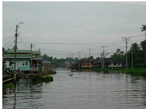
บรรยากาศในคลองบางกอกน้อย

คลองบางกอกน้อย เป็นคลองที่แยกจากแม่น้ำเจ้าพระยาที่ตำบลไทรม้า อำเภอมือง จังหวัดนนทบุรี ไหลไปทางทิศตะวันตก ผ่านตำบลบางศรีเมือง บางกร่าง, บางรักน้อย อำเภอมืองนนทบุรี เข้าเขตอำเภอบางใหญ่ที่ตำบลเสาธงหิน แล้วมีคลองบางใหญ่มารวม คลองคงไหลไปทางทิศ