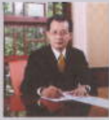
การเปลี่ยนแปลงอำนาจ อย่างหยุดอำนาจไว้เพียงอำนาจ อำนาจไม่ได้แปลว่า "อำนาจ" ต้องแปลอำนาจให้เป็นพลังสร้างสรรค์ สร้างงาน และสร้างองค์กร