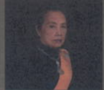
ชื่อเชิงของศักรภาครัฐ ภาคเอกชน และประชาชนชาวไทย ร่วมถวายสักการะพระศพ "เจ้าฟ้าเพชรรัตนฯ"