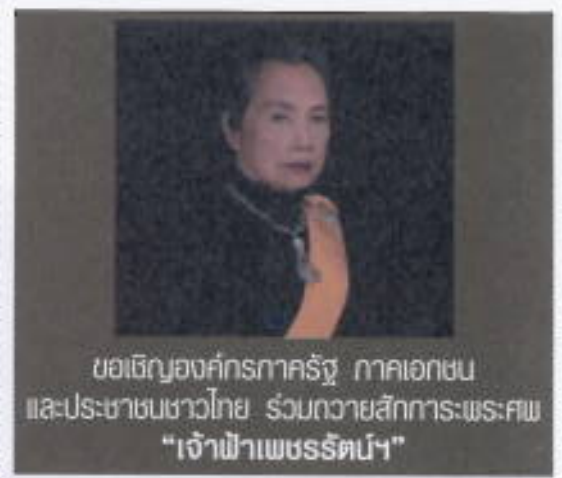
ขอเชิญองค์การภาครัฐ ภาคเอกชน และประชาชนชาวไทย ร่วมถวายสักการะพระศพ "เจ้าฟ้าเพชรรัตน"