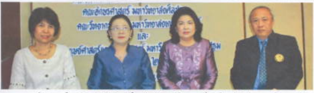
ลงนาม : คณะสังคมศาสตร์ มหาวิทยาลัยศรีนครินทรวิโรฒ ร่วมกับ คณะศึกษาศาสตร์ มหาวิทยาลัยศิลปากร คณะวิทยาการจัดการ มหาวิทยาลัยเกษตรศาสตร์ และคณะมนุษยศาสตร์และสังคมศาสตร์ มหาวิทยาลัยราชภัฏนครปฐม ลงนามความร่วมมือทางวิชาการ