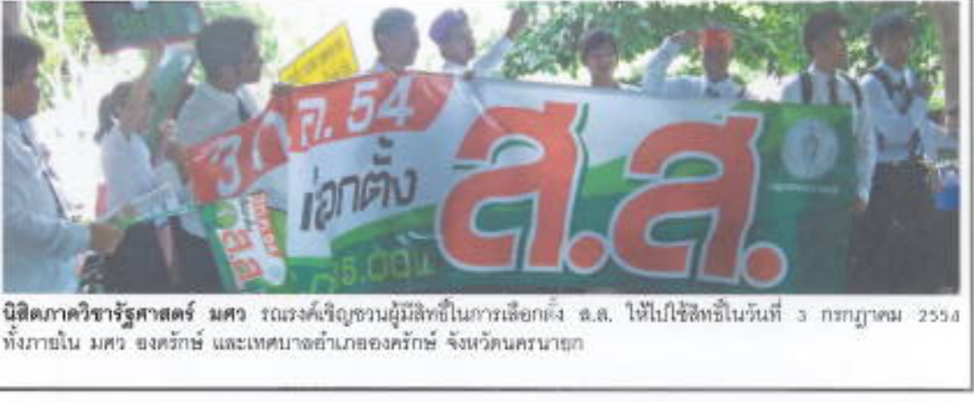
นิสิตภาคศึกษารัฐศาสตร์ มศว รณรงค์เชิญชวนผู้มีสิทธิในการเลือกตั้ง ส.ส. ให้ไปใช้สิทธิในวันที่ 3 กรกฎาคม 2554 ทั้งภายใน มศว องครักษ์ และเทศบาลตำบลองครักษ์ จังหวัดนครนายก