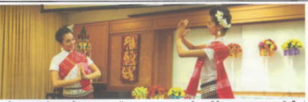
ปฐมนิเทศ : ภาควิชาภาษาไทยและภาษาตะวันออก คณะมนุษยศาสตร์ มศว จัดโครงการจรรยาบรรณครูพันธุ์ใหม่ ปฐมนิเทศนิสิตเอกภาษาไทย กศน. ชั้นปีที่ 1 และรับขวัญปีที่ 2 เอกภาษาไทย กศน. ดินถิ่น ประสานมิตร เมื่อวันที่ 22 พฤษภาคม 2554

ขอเชิญรับชม รายการข่าวโทรทัศน์ SWU CHANNEL