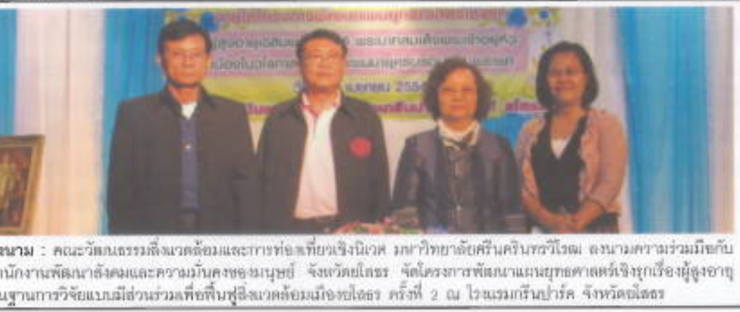
ลงนาม : คณะวัฒนธรรมสิ่งแวดล้อมและการท่องเที่ยวเชิงนิเวศ มหาวิทยาลัยศรีนครินทรวิโรฒ ลงนามความร่วมมือกับสำนักงานพัฒนาสังคมและความมั่นคงของมนุษย์ จังหวัดยโสธร จัดโครงการพัฒนาแผนยุทธศาสตร์เชิงรุกเรื่องผู้สูงอายุ บนฐานการวิจัยแบบมีส่วนร่วมเพื่อฟื้นฟูสังคมวัยชราครั้งที่ 2 ณ โรงแรมกรีนปาร์ค จังหวัดยโสธร