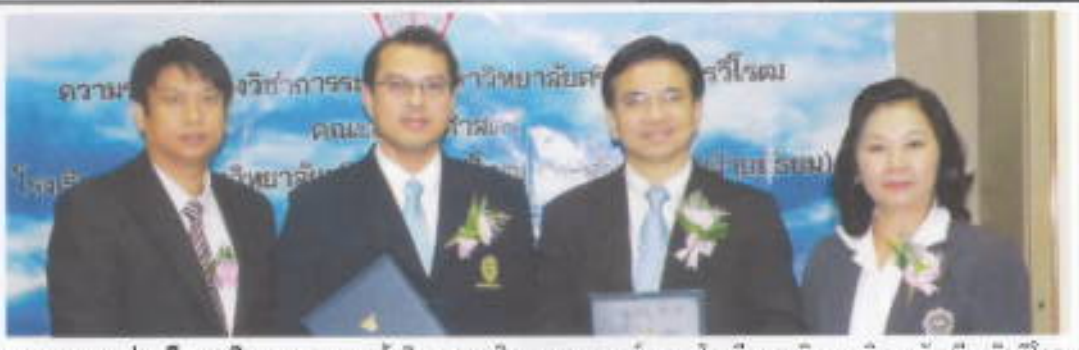
ลงนามความร่วมมือทางวิชาการ : คณะผู้บริหารคณะวิศวกรรมศาสตร์ และ โรงเรียนสาธิตมหาวิทยาลัยศรีนครินทรวิโรฒ ประสานมิตร (ฝ่ายมัธยม) ร่วมลงนามบันทึกข้อตกลงความร่วมมือในการพิจารณาเทียบนักเรียนเข้าศึกษาต่อในระดับปริญญาตรี ในคณะวิศวกรรมศาสตร์ มศว อังกรวาท