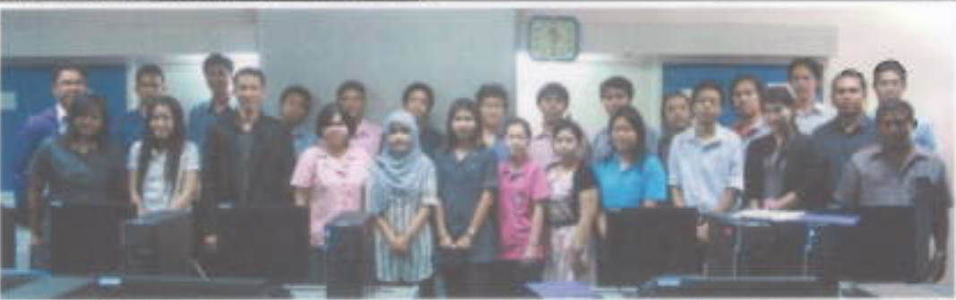
ไอซีที : สำนักคอมพิวเตอร์ มหาวิทยาลัยศรีนครินทรวิโรฒ จัดโครงการบริการวิชาการเพื่อการพัฒนาสมรรถนะด้านไอซีที ครั้งที่ 8 ไรท์แอนด์ นิสิต คณาจารย์ และบุคลากร มศว ระหว่าง 26 เมษายน 2554 ถึง 12 พฤษภาคม 2554 ณ ห้องปฏิบัติการ คอมพิวเตอร์ สำนักคอมพิวเตอร์ มศว ประสานมิตร