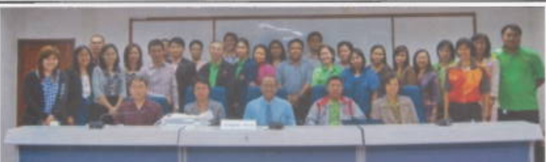
จัดทำแผนฯ : คณะพ่อตึกษา มหาวิทยาลัยศรีนครินทรวิโรฒ (มศว) โดยงานแผนและนโยบาย และประกันคุณภาพการ ศึกษา จัดโครงการพัฒนาบุคลากร คณะพ่อตึกษา เรื่อง "การจัดทำ SWOT Analysis และการวิเคราะห์แผนยุทธศาสตร์ คณะพ่อตึกษา" ระหว่างวันที่ 10-12 พฤษภาคม 2554

ขอเชิญร่วมบริจาคเงิน เพื่อเป็นค่าใช้จ่ายทางการแพทย์ช่วยเหลือ ผู้ป่วยยากไร้ และจัดซื้ออุปกรณ์การ แพทย์ บริจาคได้ที่หน่วยงานการเงิน และบัญชี ศึกษอำนาจการชั้น 2 หรือ โอนเงินเข้าบัญชีโรงพยาบาล ชลประทานมูลนิธิ อาคารกรุงเทพ ลานาพริยาม เลขที่บัญชี 110-000168-2 (กรุณาโอนแจ้งรายละเอียดก่อนการ บริจาค) ตั้งแต่บัดนี้เป็นต้นไป โทร. 02-502-2345 ต่อ 1075-1015 ศูนย์ การแพทย์ปัญญาันนภิกขุ ชลประทาน มหาวิทยาลัยศรีนครินทรวิโรฒ