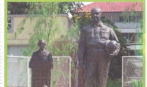
วาระ 62 ปี มหาวิทยาลัยศรีนครินทรวิโรฒ ขอพระอัฐมพิพิธภัณฑสถานแห่งชาติ นครปฐมเพื่อประดิษฐานพระอัฐมเป็นอนุสรณ์