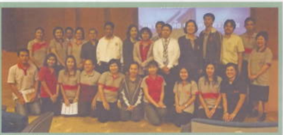
มศว อุทยานประเพณีคัลติวงาน : สำนักงานอธิการบดี โดยฝ่ายจัดการทรัพย์สิน นำคณะบุคลากรจากทุกหน่วยงานในสังกัดของสำนักงานอธิการบดี เข้าศึกษาอุทยานด้านการประเพณีคัลติวงาน ณ อาคารอนุรักษ์พลังงานเฉลิมพระเกียรติ จัตุรัสพหลโยธิน เมื่อวันที่ 2 เมษายน 2554