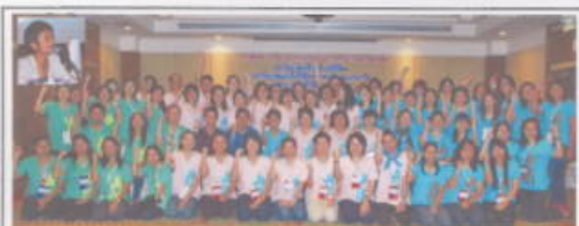
มหาวิทยาลัยศรีนครินทรวิโรฒ มหาวิทยาลัยเทคโนโลยีราชมงคลธัญบุรี และมหาวิทยาลัยเทคโนโลยีพระจอมเกล้าพระนครเหนือ จัดอบรมความรู้ : การบริหารฐานความรู้ด้วยชุมชนศึกษา ประจำปี 2554 ระหว่างวันที่ 24 - 25 มีนาคม 2554 ณ โรงแรมอัสสัมชัญ อิน รีสอร์ท จังหวัด นนทบุรี

ขอเชิญรับชม รายการข่าวโทรทัศน์ SWU CHANNEL