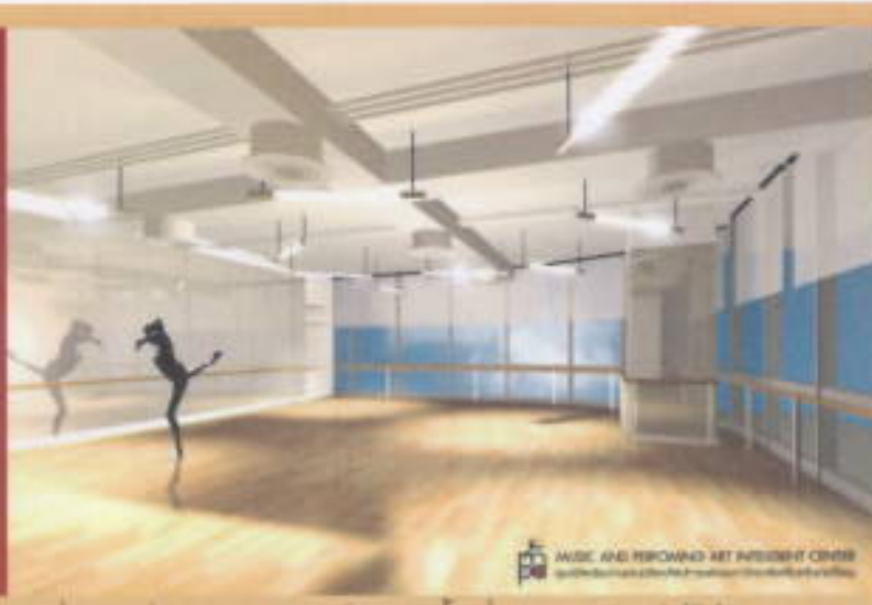
SWU AND BEYOND ART RESERVE CENTER

“ศูนย์ศิลปกรรมแห่งประเทศไทยจะเป็นแห่งแรกของประเทศไทยที่เปิดพื้นที่เพื่อนำงานด้านศิลปะที่ก้าวเข้าสู่ความเป็นสากล ที่จะมีการนิทรรศการและการแสดงศักยภาพทางศิลปะแขนงต่างๆ ตลอดทั้งปี” ศ.ดร.วิฑูร ตั้งเจริญ อธิการบดี มหาวิทยาลัยศรีนครินทรวิโรฒ (มศว) ผู้ริเริ่มจัดตั้งศูนย์กล่าว