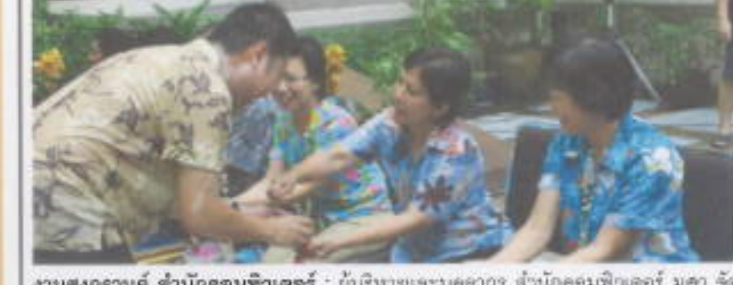
งานสงกรานต์ สำนักคอมพิวเตอร์ : ผู้บริหารและบุคลากร สำนักคอมพิวเตอร์ มศว จัดงานอนุรักษ์และสืบสานประเพณีสงกรานต์ไทย รดน้ำขอพรผู้ใหญ่ เมื่อวันที่ 11 เมษายน 2554 ณ ลานพลาซ่า ชั้น 2 สำนักคอมพิวเตอร์ มศว ประสานมิตร