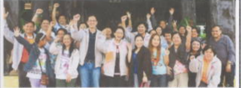
กองบริการการศึกษา : จัดสัมมนาการจัดทำแผนยุทธศาสตร์ กองบริการการศึกษา ประจำปี การศึกษา 2555 และการบริหารความเสี่ยง กองบริการการศึกษา ระหว่างวันที่ 24-26 มีนาคม 2554 ณ พุทธสาส์นวิสิธวิท จังหวัดนครราชสีมา