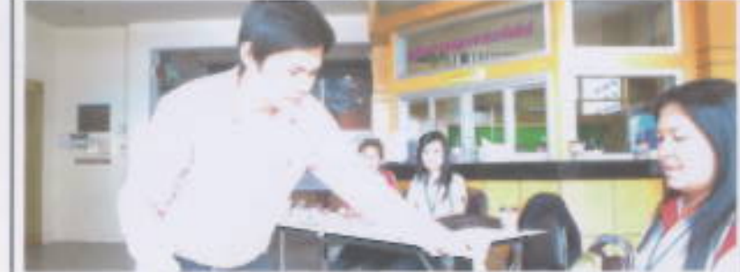
บุคลากร : มหาวิทยาลัยศรีนครินทรวิโรฒ (มศว) จากทุกหน่วยงาน เลือกคณะกรรมการ สภาคณาจารย์และข้าราชการ ประเภททั่วไป เมื่อวันที่ 5 เมษายน ณ ตึกฝึกงานอธิการบดี มศว ประสานมิตร

โลก ซึ่งโดยทั่วไปมักจะมีลักษณะบูนิเช็กซ์และไมเพอติ ตัว เริ่มสร้างสรรคงานด้วยการถอดหรือโครงสร้าง เสื้อผ้าที่มีความรัดแค้ง แล้วหีบมาจนรวมกัน ใหม่ให้ลงตัว ก่อให้เกิดเป็นชิ้นงานที่มีความโดดเด่น จนได้รับรางวัล Collection of the year by Singha ไปท่ามกลางเสียงปรบมือแสดงความยินดีของ ทุกคนที่มีโอกาสได้มาร่วมชมโชว์ในวันนั้น.