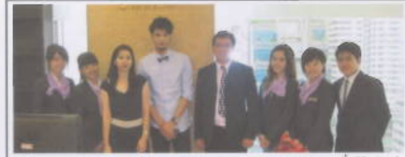
โรงแรมสุเทพ : รายการ Go-Go-Guide ทางช่อง YOU CHANNEL (เคเบิลทีวี) ถ่ายทำ เทปบันทึกภาพแนะนำโรงแรมสุเทพ มศว ถนนอภิรามันต์ โดยออกอากาศระหว่างวันที่ 29 - 31 มีนาคม และ 1 เมษายน 2554 เวลา 9.00-10.00 น. และ 23.00-00.00 น.