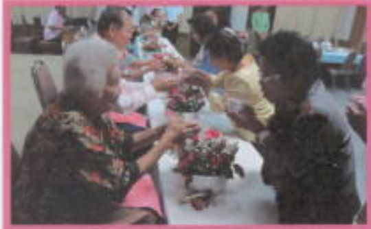
ขอเชิญชวนประชาคมชาว มศว ร่วมงานสืบสานประเพณีไทย วันสงกรานต์ไทย วันที่ 7 เมษายน 2554 ณ มศว องครักษ์