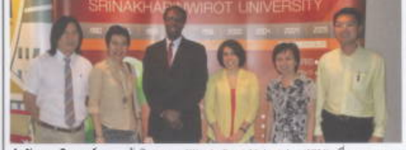
สำนักคอมพิวเตอร์ : คณะผู้บริหารจาก Illinois State University (ISU) เพื่อเจรจาความ ร่วมมือทางวิชาการและเชิญชวนสำนักคอมพิวเตอร์ เมื่อวันที่ 28 กุมภาพันธ์ 2554 ณ ห้องประชุมทางไกล (VC1) ชั้น 4 อาคาร 16 สำนักคอมพิวเตอร์