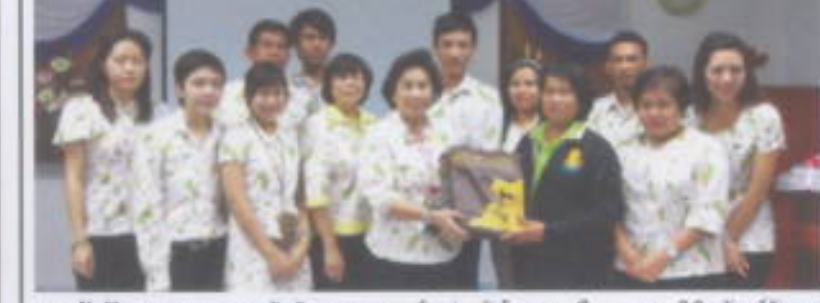
สถาบันวัฒนธรรม : สถาบันวัฒนธรรมและศิลปะ จัดโครงการศึกษาดูงานพิพิธภัณฑ์วัฒนธรรม บ้านแก้ว สมเด็จพระนางเจ้ารำไพพรรณี โครงการถ่มนันทนาการแผนยุทธศาสตร์และการ ประกันคุณภาพทางการศึกษา ระหว่างวันที่ 23 - 26 กุมภาพันธ์ 2554 ณ จังหวัดจันทบุรี