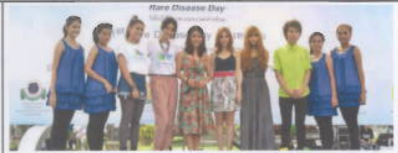
คณะศิลปกรรมศาสตร์ : จัดโครงการพัฒนาศักยภาพนิสิตและจิตสำนึกสาธารณะ ศิลปกรรม สร้างสรรค์สังคม เพื่อใส่ใจใส่ใจโอกาสคนความเท่าเทียม Rare But Equal ร่วมพลังช่วยเหลือนิสิต ผู้ป่วยผ่านกระบวนการทางศิลปะ เมื่อวันที่ 27 กุมภาพันธ์ 2554 ณ สวนสุขภาพ