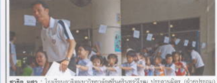
ชาอิต มศว : โรงเรียนสาธิตมหาวิทยาลัยศรีนครินทรวิโรฒ ประสานมิตร (ฝ่ายประถม) ทยอยคัดเลือกนักเรียนเตรียมประถม มีเกณฑ์รับนักเรียน 280 คน โดยมีผู้ปกครองให้ความสนใจพาบุตรหลานมาสมัครกว่า 4,000 คน เมื่อวันที่ 15 มกราคม 2554 ณ โรงเรียนชาอิต มศว