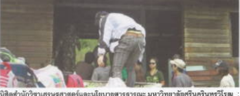
นิสิตสำนักวิชาเศรษฐศาสตร์และนโยบายสาธารณะ มหาวิทยาลัยศรีนครินทรวิโรฒ : จัดค่ายเศรษฐศาสตร์ปัญญา ระหว่างวันที่ 12 - 16 มีนาคม 2554 ณ เขตรักษาพันธุ์สัตว์ป่าเขาฉกรรจ์ จ.กาญจนบุรี

ขอเชิญชวนศิษย์เก่าและศิษย์ปัจจุบัน เข้าร่วมโครงการประชาสัมพันธ์เผยแพร่ข้อมูลข่าวสารของหน่วยงานต่างๆ ภายใน มศว ผ่านสื่อโทรทัศน์ SWU Channel และสื่อสิ่งพิมพ์ต่างๆ ได้แก่ SWU Weekly (หนังสือพิมพ์ข่าวรายสัปดาห์) มศว บทกวีฉบับใกล้ (วารสารรายเดือน) มศว ชูชน (วารสารราย 3 เดือน) มศว โลกทัศน์ (วารสารราย 3 เดือน) และป้ายคำขวัญฟรี 3 ช่องประชาสัมพันธ์ได้ที่ prswu@swu.ac.th