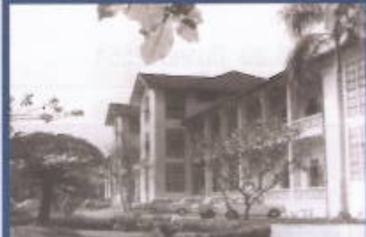
อาคารประสานมิตร อาคารที่มั่นคงของ มศว