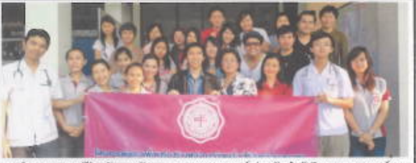
ภาควิชาวิทยาศาสตร์ป้องกันและป้องกัน คณะแพทยศาสตร์ ร่วมกับสำนักบริหารเศรษฐกิจและนโยบายสาธารณะ มศว นำนิสิตปริญญาตรี โท เอก ออกให้บริการวิชาการแก่สังคมโดยบูรณาการการเรียนการสอน ใ้ระจิมผลกระทบต่อสุขภาพจากปัญหาสิ่งแวดล้อมในพื้นที่ตั้งเป็นปีที่ 3 ระหว่างวันที่ 19-20 กุมภาพันธ์ 2554 ณ ตำบลทรายมูล อำเภอองครักษ์ จังหวัดนครนายก