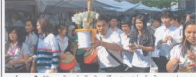
เทศน์มหาชาติ: นิสิต มหาวิทยาลัยศรีนครินทรวิโรฒ (มศว) ร่วมรับบริจาคจากประชาชนทั่วไปภายในตลาดกมโฆษาชาติ มศว ถนนอโศกมนตรี เพื่อทำบุญในพิธีเทศน์มหาชาติ ซึ่งจัดโดยสถาบันวัฒนธรรมและศิลปะ มศว เมื่อเร็วๆ นี้