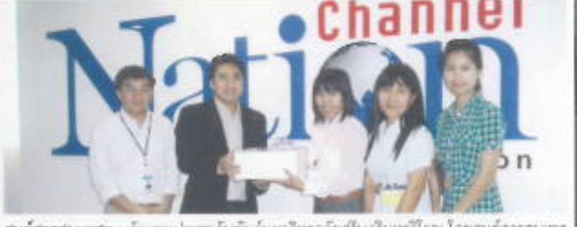
ศูนย์สารสนเทศฯ: ทีมงานประชาสัมพันธ์มหาวิทยาลัยศรีนครินทรวิโรฒ โดยศูนย์สารสนเทศและการประชาสัมพันธ์ นำของขวัญมอบแก่สื่อมวลชนทุกแขนงเนื่องในโอกาสวันขึ้นปีใหม่ 2554

จะมีศูนย์สารสนเทศและการประชาสัมพันธ์ ให้ข้อมูลทางเพื่อการประชาสัมพันธ์ของมหาวิทยาลัยศรีนครินทรวิโรฒ ภาควิชา มศว ผ่านสื่อโทรทัศน์ SWU Channel และสื่อสิ่งพิมพ์ต่างๆ ได้แก่ SWU Weekly (หนังสือพิมพ์ข่าวรายสัปดาห์) มศว นอกเวลา (วารสารรายเดือน) มศว ชูชน (วารสารราย 2 เดือน) มศว โลกทัศน์ (วารสารราย 3 เดือน) และป้ายประชาสัมพันธ์ทาง สภาฯประชาสัมพันธ์ได้ที่ prswunews@gmail.com