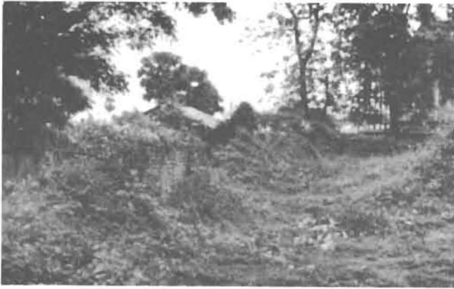
กำแพงเมืองด้านเหนือที่วัดโพธิญาณ

โบสถ์หรือวิหาร ซึ่งทางกรมศิลปากรได้ทำการขุดแต่งไว้อย่างถูกต้องหลักวิชา ฐานเจดีย์เป็นแบบเหลี่ยมย่อมุมไม้สิบสอง ไม่ทราบว่างค์เจดีย์จะมี รูปร่างอย่างไร ส่วนฐานโบสถ์หรือวิหารนั้น มีเสากายในอยู่ 2 แถว และมีใบเสมาหินมากมาย ซึ่งทางวัดได้นำไปใช้กับพระอุโบสถที่สร้างขึ้นใหม่ นอกจากนั้นยังมีกำแพงเมืองที่สมบูรณ์พอสมควรอยู่ติดกับบริเวณวัด ทางทิศเหนือ และมีต้นโพธิขนาดใหญ่ 1 ต้น