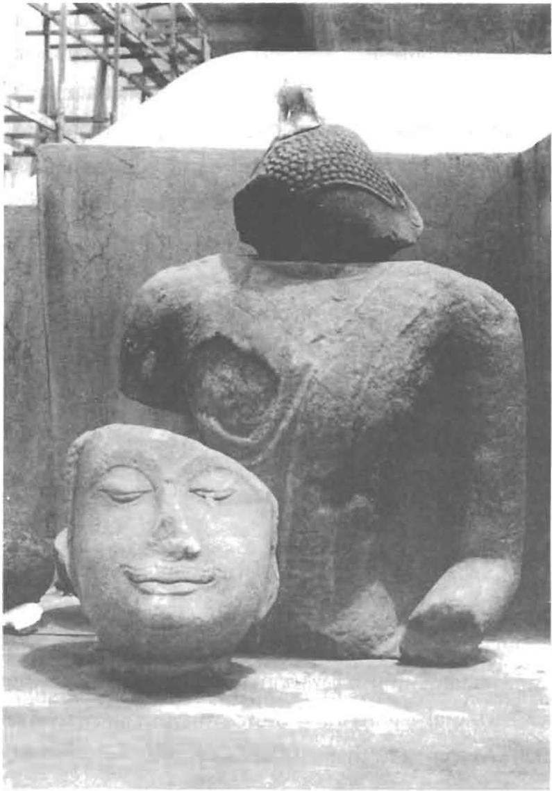
ซากพระพุทธรูปที่วัดท่ามะปรางค์ ถ่ายภาพเมื่อปี พ.ศ. 2514