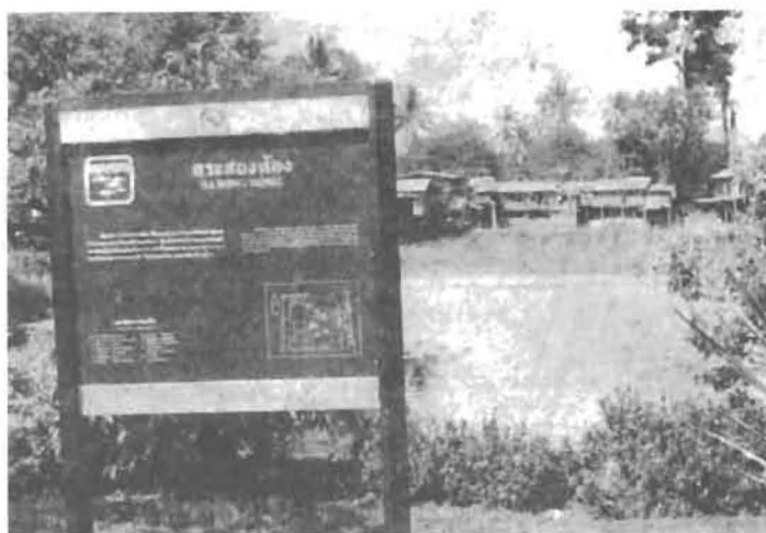
สระสองห้อง

เทพาว่านั้น งามจะเป็นฐานห้องพระโรง เพราะท่วงทีที่ท่าเหมือนกับ ปราสาทวิหารสมเด็จพระกรุงเก่าที่เคยได้เห็นมา ได้ขอให้พระยาเทพาคันดู ถ้าพบอายสิ่งทีก่ออิฐให้ถางไว้...”