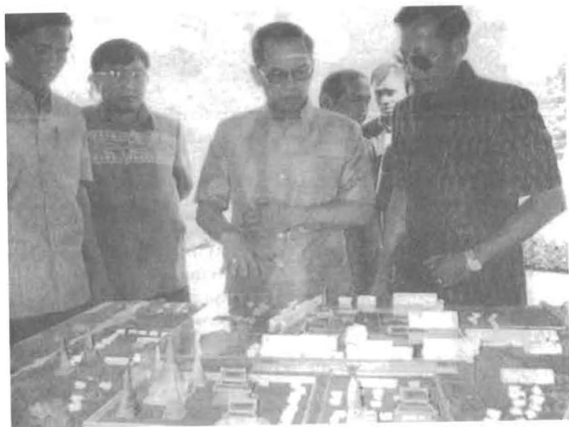
นายปองพล อดิเรกสาร รัฐมนตรีกระทรวงศึกษาธิการ กำลังชมรูปจำลองพระราชวังจันทน์