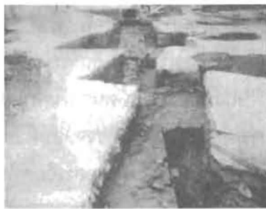
แนวกำแพงของพระราชวังจันทน์ (ภาพจากมติชนฉบับวันที่ 19 ธันวาคม 2545)