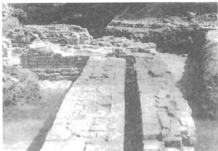
พระราชวังจันทน์ที่กรมศิลปากรขุดตรวจสอบ เมื่อปี พ.ศ. 2533 พบแนวกำแพงถูกสร้างไว้ 2 ชั้น