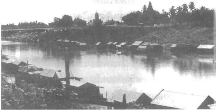
แม่น้ำน่าน สะพานนเรศวร วัดพระศรีรัตนมหาธาตุวรมหาวิหาร และวัดราชบูรณะ

เหนือสถานีรถไฟเพียงเล็กน้อย ก็หักมุมตรงไปยังข้างกองบังคับการ ตำรวจภูธรภาค 6 ซึ่งมีซากกำแพงเมืองเหลืออยู่ แล้วข้ามฟากแม่น้ำ น่านไปฟากตะวันตกได้สถาบันราชภัฏพิบูลสงครามไปตามถนนพระร่วง ขึ้นไปทางเหนือเข้าไปในค่ายสมเด็จพระนเรศวรมหาราช แล้วข้าม แม่น้ำน่านไปยังฝั่งตะวันออกที่เหนือวัดโพธิญาณ แนวกำแพงเมือง ทั้งหมดนี้มีความยาวประมาณ 2,400 เมตร และกว้างประมาณ 600 เมตร