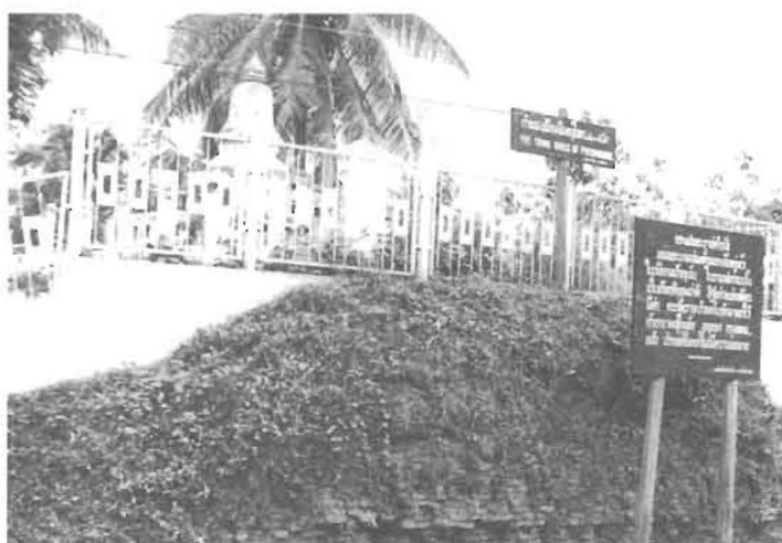
ซากกำแพงเมืองข้างกองบังคับการตำรวจภูธร เขต 6 ถ่ายภาพเมื่อปี พ.ศ. 2514

น้ำจะกัดเซาะกำแพงเมืองนี้พังลงน้ำไปมากทีเดียว นอกจากนี้ที่หลัง สถาบันราชภัฏพิบูลสงครามฝั่งตะวันตกของแม่น้ำน่านก็มีอยู่ แต่ได้ ถูกเกรดทำเป็นถนนพระร่วงเสียแล้ว และริมถนนทางตะวันตกนั้น เข้าใจว่าเป็นคูเมืองเดิม ซึ่งเข้าใจกันอีกว่าคงเป็นแม่น้ำน่านเดิมด้วย