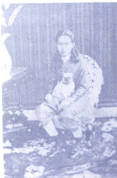
ภาพ ๗ : เจ้าคุณพระประยูรวงศ์ ถ่ายประมาณ พ.ศ. ๒๔๑๖