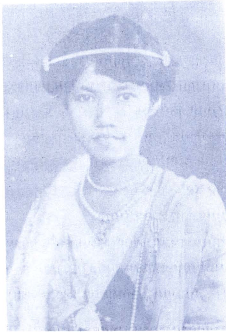
ภาพ ๑๕ : สมเด็จพระเจ้าฟ้ากรมหลวงเพชรบุรีราชสิรินทร ทรงไว้ผมโป่ง

จวบจนในสมัยรัชกาลที่ ๗ (พ.ศ. ๒๔๖๘ - ๒๔๗๗) “แบบเสื้อต่างๆ ของสตรีแทบจะกล่าวได้ว่า ลอกมาจากหนังสือแบบเสื้อตะวันตกที่ส่งเข้ามาขายในสมัยนั้น หรือลอกเลียนแบบจากภาพยนตร์ฝรั่งที่เข้ามาฉาย ซึ่งส่วนใหญ่เป็นภาพยนตร์อเมริกัน” (กองจดหมายเหตุแห่งชาติ : ๒๕๒๕ ; ๓๔) ลักษณะเด่นของการแต่งกายสตรีในยุคนี้ คือ เสื้อตัวหลวมยาวคลุมสะโพก ไม่มีแขน ชายเสื้ออาจทำคล้ายโบผูกห้อยทิ้งชายด้านข้าง คอเสื้อกลมกว้าง คอวี ไม่นิยมทำปกเสื้อ นุ่งกับถุงสำเร็จยาวแค่ปรกเข่าเล็กน้อย นิยมขึ้นพื้นไม่มีลายและเชิง เลิกสะพายแพร เครื่องประดับยังคงเป็นสร้อยมุก สร้อยทองเส้นสั้นๆ ไม่ยาวเหมือนกับสมัยรัชกาลที่ ๖ ข้อมือนิยมสร้อยข้อมือที่คล้ายลูกบิด สวมถุงน่องสีพื้น กับรองเท้าส้นสูง