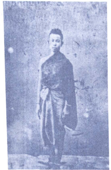
ภาพ ๖ : สมัยรัชกาลที่ ๕ หญิงนุ่งโจงกระเบน ไว้ผมปีก

จวบจนในสมัยรัชกาลที่ ๕ (พ.ศ. ๒๔๑๑ - ๒๔๕๓) ด้วยสาเหตุของการติดต่อกับต่างประเทศมีมากขึ้น ทั้งทางด้านการค้า และการศึกษา สิ่งต่างๆ เหล่านี้มีส่วนทำให้วัฒนธรรมการแต่งกายของชาวตะวันตกเข้ามามีส่วนสัมพันธ์กับวัฒนธรรมการแต่งกายของสตรีไทยมากขึ้น