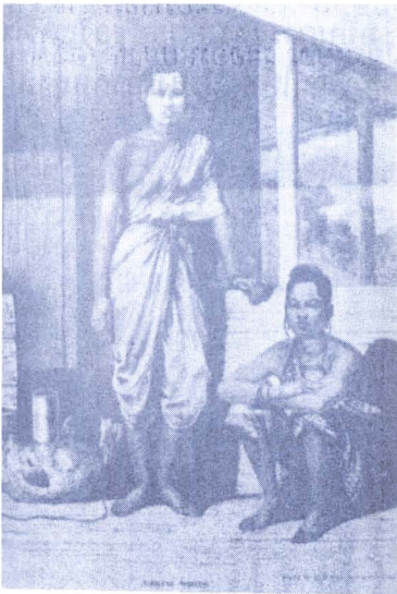
ภาพ ๕ : สมัยรัชกาลที่ ๔ หญิงนุ่งโจงกระเบน ไว้ผมปีกและไว้จอนหูยาว