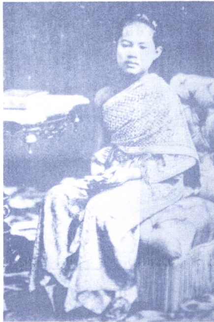
ภาพ ๓ : สมเด็จพระนางเจ้าสุภัททันตาภุมาริรัตน พระบรมราชเทวีในรัชกาลที่ ๕ ทรงนุ่งจีบฉลองพระบาทแบบฝรั่ง