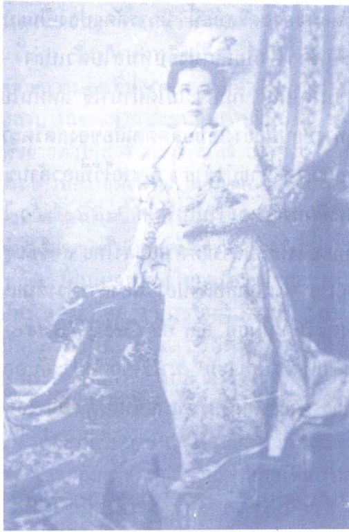
ภาพ ๕ : สมเด็จพระศรีพัชรินทราบรมราชินีนาถทรงฉาย พ.ศ. ๒๔๓๘ ทรงชุดทรงตามแบบแฟชั่นตะวันตก ในยุค Fin de Siècle

ปลายรัชกาลที่ ๕ แบบเสื้อของสตรีไทยได้เปลี่ยนไปอีก เป็นเสื้อลูกไม้ตัดแบบยุโรป นิยมตัดแบบคอตั้งสูง แขนยาวพองฟูมีระบายลูกไม้เป็นชั้นๆ รอบแขนเสื้อ ตกแต่งด้วยริบบิ้น เอวเสื้อจีบรัดเข้ารูปหรือคาดเข็มขัด สะพายแพร สวมถุงเท้าที่มีลายโปร่ง หรือปักด้วยด้ายงดงาม สวมรองเท้าส้นสูง แพรสะพายก็มีลักษณะเป็นแพรฝรั่งระบายหย่อนพองาม เป็นผ้าที่สั่งเข้ามาสำหรับเป็นแพรสะพายโดยเฉพาะ เครื่องประดับนิยมสร้อยไข่มุกซ้อนกันหลายๆ เส้น มีการประดับประดาด้วยเพชรนิลจินดามากกว่าแต่ก่อน ซึ่งส่วนใหญ่เครื่องประดับจะออกแบบแล้วสั่งทำจากต่างประเทศ