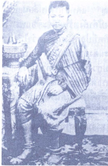
ภาพ ๔ : พระองค์เจ้าหญิงทักษิณุชา พระราชธิดาในรัชกาลที่ ๔ ทรงนุ่งพระภูษาแบบโจงกระเบน แต่เป็นผ้าทอสอดทอง และมีเชิง