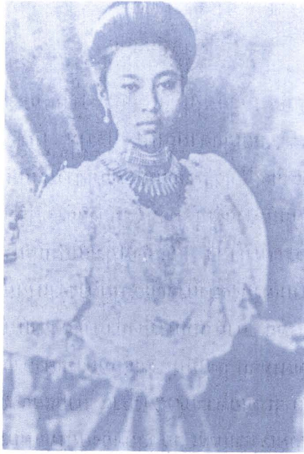
ภาพ ๑๐ : เจ้าจอมหม่อมราชวงศ์สดับ ลดาวัลย์ ถ่ายในสมัยรัชกาลที่ ๕