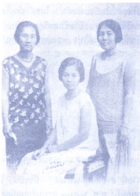
ภาพ ๑๖ : พระองค์เจ้าหญิงอภันตริปชา, พระองค์เจ้าหญิงอดิสรีย์สุริยาภา และพระองค์เจ้าหญิงอาทรทิพยอาภา ทรงฉลองพระองค์ตามแบบการแต่งกายสตรีในสมัยรัชกาลที่ ๗

ทรงผมในยุคนี้นิยมทำ “ผมคลื่น” ผมตัดลอนด้วยน้ำยาตัด และคีมเผาไฟจากเตาด่าน และผมทรง ชิงเกิล ซึ่งคล้ายผมบ๊อบเดิมแต่ตัดสั้นเข้าที่ท้ายทอยจนเห็นเชิงผมสูงคล้ายผมผู้ชาย รวมทั้งทรง “อีตันครีอบ” ซึ่งเป็นทรงผมสั้นขอยเชิงผมขึ้นสูง และตัดเปิดให้เห็นโบริหู ผมทรงสั้นเหล่านี้จะเป็นที่นิยมเฉพาะผู้ที่ทันสมัยบางคนเท่านั้น