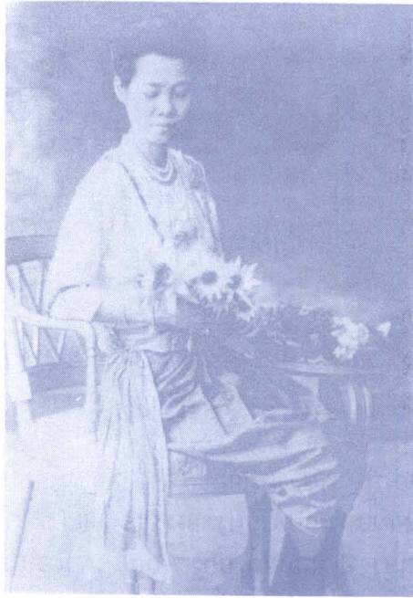
ภาพ ๑๓: สมเด็จพระเจ้าฟ้า กรมขุนศรีสัชนาลัยสุรกัญญา ฉลองพระองค์แบบสตรีสมัยต้นรัชกาลที่ ๖