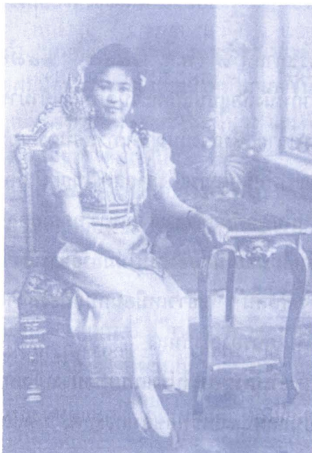
ภาพ ๑๔ : พระนางเชลลขมลาวณ ฉลองพระองค์ตกแต่งด้วยผ้าเปรงบาง สร้อยพระศอไข่มุก เส้นยาว ไม่ทรงสะพายแพร แต่ใช้ภูษาพันรอบบั้นพระองค์ ฉลองพระบาทสั้นสูง และถุงพระบาทไม่มีลาย