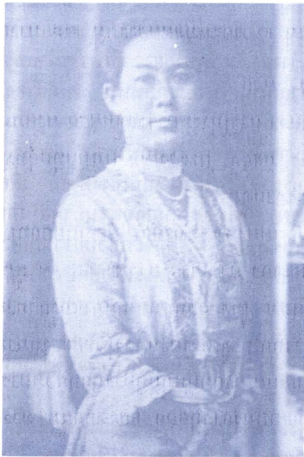
ภาพ ๑๑ : สมเด็จพระเจ้าฟ้าหญิงสุทธาทิพยรัตน์ สุขุมวดี วัดดิยกุลยาวดี (สมเด็จพระเจ้าฟ้ากรมหลวงศรีรัตนโกสินทร์) พระราชธิดาในรัชกาลที่ ๕