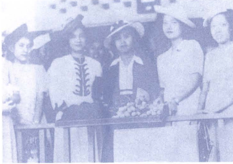
ภาพ ๑๗ : หญิงไทยสวมหมวก ในสมัยรัชกาลที่ ๘

ทรงผมของสตรีในยุคนี้เริ่มนิยมมัดตัด โดยตัดด้วยไฟฟ้าเป็นลอน และไว้ผมยาวมากขึ้น มีการตัดยาวแบบสตรีตะวันตก สำหรับสตรีสูงอายุนิยมเกล้ามวยส่วนมากก็เป็นมวยเรียบ ๆ อย่างไม่รู้ก็ตีชาวบ้านทั่ว ๆ ไปก็คกงุ่นผ้าถุง เพราะกระโปรงเป็นเรื่องของชาวกรุง