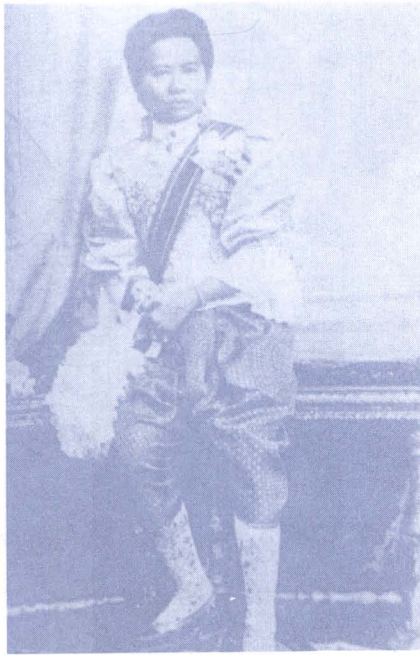
ภาพ ๑๒ : พระนางเจ้าสุกุมลมารศรีพระราชเทวี ในรัชกาลที่ ๕