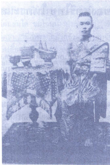
ภาพ ๒ : สมเด็จพระเทพศิรินทราบรมราชินี อัครมเหสีในพระบาทสมเด็จพระจอมเกล้าเจ้าอยู่หัว ทรงสไบ ๒ ชั้น ชั้นในเป็นสไบแพรจีบ ชั้นนอกเป็นสไบคาดทองยกดอก ทรงพระภูษาจีบผ้าคาดทองยกดอก