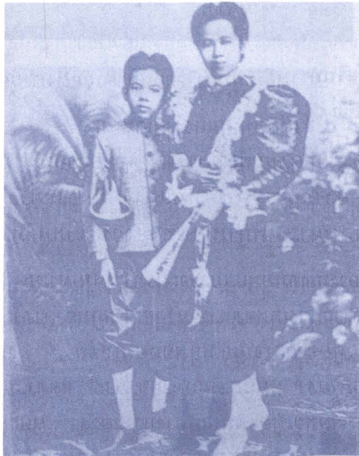
ภาพ ๘ : สมเด็จพระเจ้าฟ้ากรมหลวงลพบุรีราเมศวร์ ทรงฉายกับพระวิมาดาเธอกรมพระสุทธาสินีนาฏฯ ทรงฉายเมื่อ พ.ศ. ๒๔๓๕

หลังจากการเสด็จประพาสยุโรปใน พ.ศ. ๒๔๕๐ แล้ว ได้มีการนำเอาแบบอย่างการแต่งกายของสตรียุโรปมาดัดแปลงใช้กับการแต่งกายของไทย สตรีชั้นสูงของไทยเริ่มใช้เสื้อตัดตามแบบอังกฤษสมัยควีนวิกตอเรีย ซึ่งเป็นเสื้อแขนยาวพองตรงช่วงต้นแขน คอเสื้อตั้งสูง ตามแบบของแฟชั่นการแต่งกายของตะวันตกในยุค Fin de Siècle (๑๘๙๐-๑๙๐๐) สตรีไทยชั้นสูงนำโครงสร้างของเสื้อแขนพอง “แขนขาหมูแฮม” มาใช้โดยตัดประดับตกแต่งด้วยลูกไม้ โดยใช้คู่กับการนุ่งโจงกระเบนเป็นผ้าม่วง ผ้าลาย หรือผ้าพื้นสีเข้ากับตัวเสื้อ ใส่สายสะพายแพร สวมถุงน่อง รองเท้า