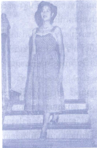
ภาพ ๑๘ : กระโปรงนิวลูก ในตอนต้นสมัยรัชกาลที่ ๕

กระทั่งสมัยรัชกาลที่ ๕ (พ.ศ. ๒๔๘๕ - ปัจจุบัน) ในระยะแรกที่ต่อเนื่องมาจากรัฐบาลก่อนในช่วง ๑๐ ปีแรกก่อนถึง พ.ศ. ๒๕๐๐ การเปลี่ยนแปลงด้านการแต่งกายของสตรีในเมืองกรุงของไทยก็คือรูปแบบกระโปรงนิวลูก ซึ่งเป็นกระโปรงผ้าเจดีย์วงกลม รวมทั้งมีรูปแบบกระโปรงผ้า ๔ ชั้น ๖ ชั้น และ ๘ ชั้น รวมทั้งกระโปรงจีบรอบตัว ความยาวของกระโปรงจะยาวคลุมเข่าเล็กน้อย เสื้อมีคอแบบต่างๆ คอกกลม คอวี คอสี่เหลี่ยม ปกบัว ปกฮาวาย เชิ้ต แขนเสื้อนิยมแขนสั้น ความยาวคลุมต้นแขน นอกจากกระโปรงนิวลูกแล้ว กระโปรงเชือกยาวคลุมเข่าก็ยังคงมีให้พอเห็นได้ ทรงผมตัดลอนได้รับความนิยมแพร่หลาย แต่นิยมแสกข้าง