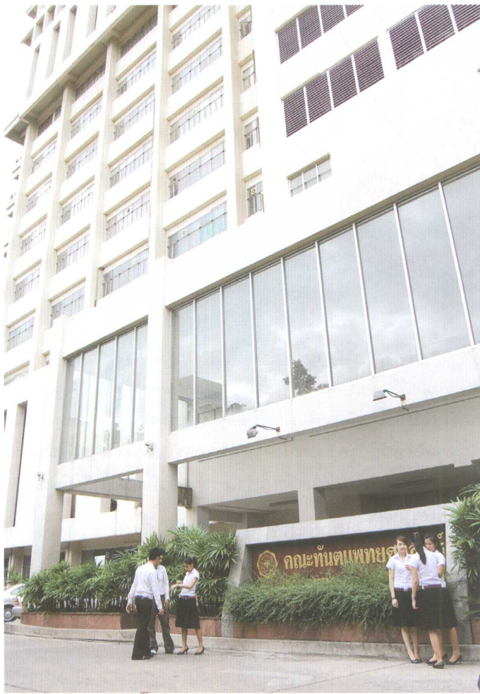
*ตึกคณะทันตแพทยศาสตร์