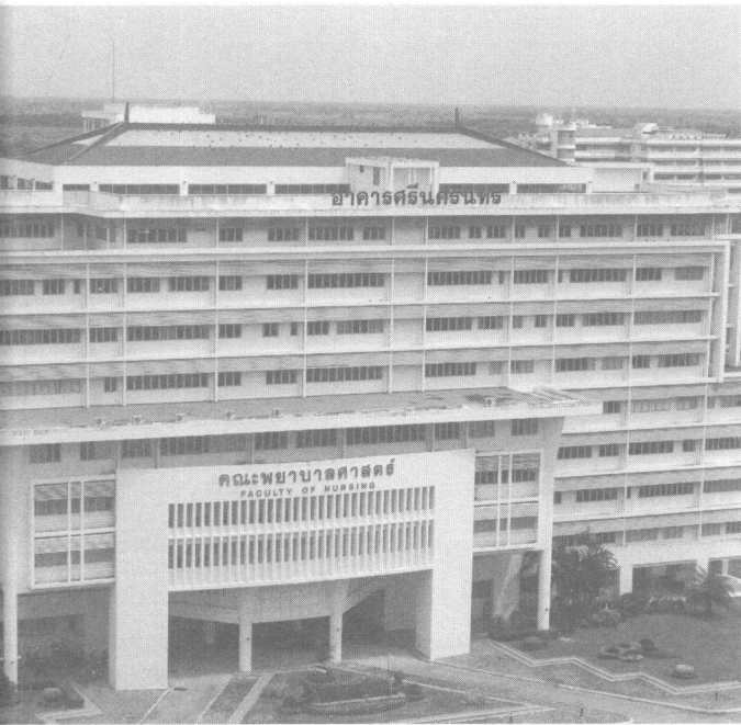
*อาคารคณะพยาบาลศาสตร์

ตลอดการเรียนในระดับชั้นประถมศึกษาจนจบมัธยมปลาย ฉันทัดใจฝึนและตั้งใจอย่างยิ่งที่จะทำความฝันของตัวเองให้สำเร็จ ความฝันของฉันท้อจะเป็นความฝันเล็กๆ ที่ไม่หวือหวาเหมือนเพื่อนๆ ออกจะคิดว่าธรรมดาไปด้วยซ้ำ เพราะอาชีพของการเป็นนางพยาบาลนั้นคงไม่ได้รับความสนใจเท่ากับอาชีพอื่นๆ ทั่วไป แต่ใครเลยจะรู้ว่าความจริงแล้วอาชีพของนางพยาบาลก็มีความสำคัญและความน่าสนใจไม่แพ้อาชีพอื่นเช่นกัน