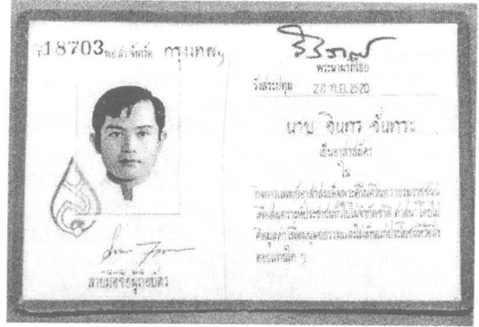
สำนักงานกลาง มูลนิธิแพชชีอาสา สมเด็จพระศรีนครินทราบรมราชชนนี