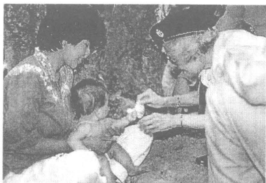
เสด็จฯ เยี่ยมราษฎรและพอ.สว. บ้านควนขุม ต.ทุ่งสัง อ.ทุ่งใหญ่ จ.นครศรีธรรมราช เมื่อวันที่ 20 เมษายน 2530

“มูลนิธิ พอ.สว. นี้ เป็นเสมือนเด็กที่ทรงเลี้ยงมาตั้งแต่แบเบาะ ทรงวางแผนด้วยพระองค์เองตลอด บางครั้งก็ทรงดีพระทัยเมื่อผลงานออกมาดี บางครั้งก็ทรงเป็นห่วง เมื่ออนาคตยังมองไม่เห็นชัดบัดนี้ พอ.สว. ก็บรรลุนิติภาวะแล้ว แต่แม่ทุกคน ถึงแม้ว่าลูกจะเติบโตเพียงใดก็ตาม จะมีความผูกพันห่วงใยอยู่ตลอดไป เช่นเดียวกัน สมเด็จพระศรีนครินทร์ราชมราชชนนี ก็ทรงมีความผูกพันห่วงใยมูลนิธิ พอ.สว. อยู่เสมอไป”