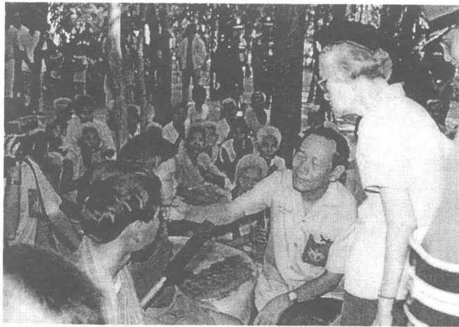
เสด็จเยี่ยมราษฎร อ.เมือง จ.สุรินทร์

สมเด็จพระศรีนครินทราบรมราชชนนีทรงรับพระราชภาระในด้านยา เครื่องใช้ ตลอดจนพาหนะสำหรับใช้ในการเดินทาง และยังพระราชทานเงินเป็นค่าอาหารกลางวันสำหรับขณะที่เดินทางไปปฏิบัติงานทุกคน รวมทั้งค่าใช้จ่ายในการรักษาพยาบาลทุกอย่าง