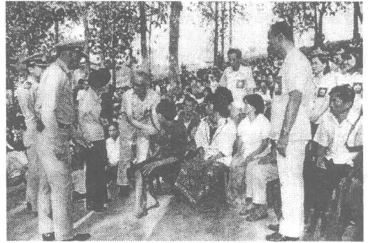
เสด็จฯ เยี่ยมราษฎร และ พอ.สว. บ้านปางผักหม ต.จิม อ.ป่ง จ.พะเยา เมื่อวันที่ 19 มกราคม 2532