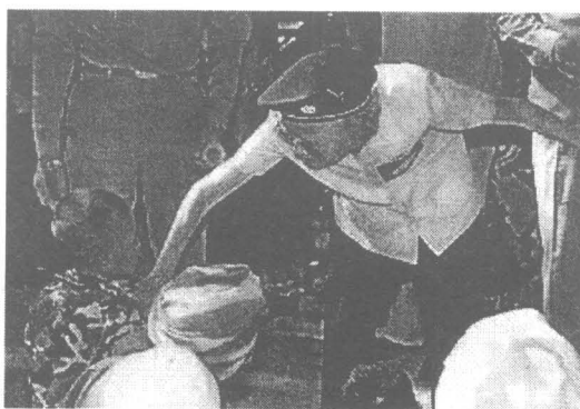
เสด็จฯ เยี่ยมราษฎรและ พอ.สว. บ้านป่าแหน ต.ศรีสาคร อ.ศรีสาคร จ.นราธิวาส เมื่อวันที่ 4 กรกฎาคม 2530