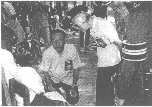
เสด็จฯ เยี่ยมราษฎร และพอ.สว. ณ พุทธสถาน ของโรงเรียนระหาร บ้านระหาร ต.เทนมีย์ อ.เมือง จ.สุรินทร์ เมื่อวันที่ 13 มีนาคม 2531