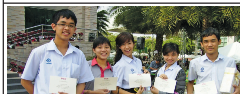
สาธิต มศว (ฝ่ายมัธยม) : นักเรียนโรงเรียนสาธิตมหาวิทยาลัยศรีนครินทรวิโรฒ (ฝ่ายมัธยม) ได้รับรางวัลรองชนะเลิศอันดับ 2 จากการแข่งขันวิชาการตอบปัญหาทางด้านการจัดการธุรกิจ เมื่อวันที่ 12 มกราคม 2554 โรงเรียนพงษ์สวัสดิ์วัฒนาวิชาการ