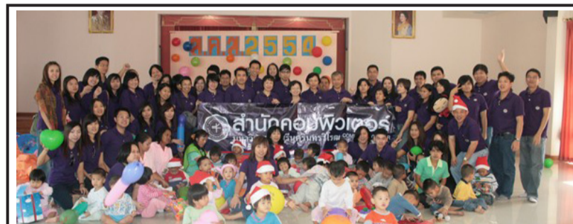
วันสถาปนาสำนักคอมพิวเตอร์ ครบรอบ 17 ปี : ผู้บริหารและบุคลากรสำนักคอมพิวเตอร์มอบของขวัญปีใหม่ 2554 และเลี้ยงอาหารกลางวันเด็ก ณ สถานสงเคราะห์เด็กอ่อนพญาไท อ.ปากเกร็ด จ.นนทบุรี

ขอเชิญรับชม รายการข่าวโทรทัศน์ SWU CHANNEL ทุกวัน เวลา 12.30 - 13.30 น.