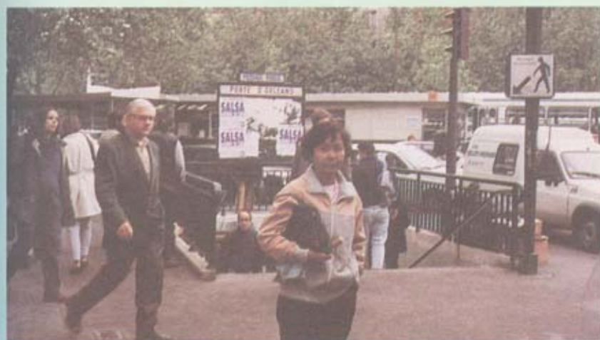
ทางลงไปชานชาลา รถไฟใต้ดิน

วันสุดท้ายในกรุงปารีส พวกเราจะเดินทางต่อไปยังกรุงเอเธนส์ เขานัดรับประทานอาหารเช้า 9.00 น. จะมีรถบัสมารับไปสนามบินเวลา 10.00 น.