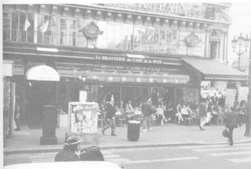
ร้านอาหารและกาแฟ ริมฟุตบาท กลางกรุงปารีส

รถไฟใต้ดินมา 90 ปีเศษแล้ว กรุงเทพมหานครของเราังไม่มีจนแล้วจนรอด ผู้เขียนลองเดินลงไปดูเห็นที่ขายตั๋ว และชานชาลากว้างขวางมาก ลงไป คุยุ่เดี๋ยวก็รีบเดินขึ้นมา จึงไม่ทันเห็นรถไฟใต้ดิน เพื่อนๆ ขวนไว้เหมือนกันว่า เมื่อหมดรายการของมัทกุเทศก์แล้ว จะพาขึ้นรถไฟใต้ดิน แต่ผู้เขียนก็ไม่ได้ไปด้วย จึงไม่ได้ขึ้นรถไฟใต้ดินของฝรั่งเศส