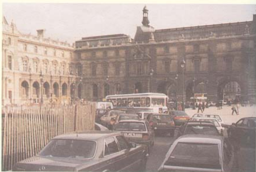
อีกมุมหนึ่งของพระราชวังลูฟว์ มีถนนรถยนต์ผ่านไปได้

นอกจากภาพโมนาลิซ่าแล้ว ทราบว่ายังมีภาพเขียนของลีโอนาร์โด ดา วินชี อีกหลายภาพ และภาพเขียนของจิตรกรที่มีชื่อเสียงอีกมากมาย เมื่อไม่ได้เข้าชมก็ต้องรีบกลับมาที่ร้าน BENLUX เกรงว่าจะไม่ทันเวลานัดขึ้นรถ แต่ก็ยังมีเวลาเดินดูสินค้าในร้าน ซึ่งพวกเราส่วนใหญ่กำลังเลือกซื้อกันอยู่ มีทั้งนาฬิกา น้ำหอม และเครื่องสำอาง และอื่นๆ เมื่อถึงเวลานัด รถบัสก็มารับตรงเวลา มีชาวต่างประเทศรอขึ้นรถแบบพวกเราเป็นจำนวนมาก มีเพื่อนๆ มาไม่ทันขึ้นรถอีก 8 คน รถต้องวนกลับมารับใหม่เป็นครั้งที่สอง