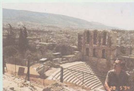
โรงละครโบราณ บนอโครโพลิส