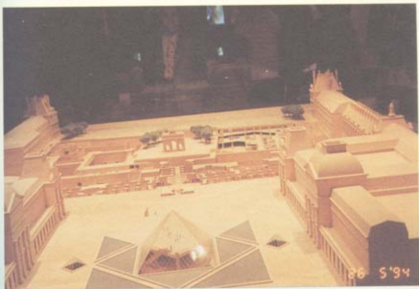
รูปจำลองพระราชวังลูฟร์ จะเห็นพีระมิดกระฉก อยู่ท่ามกลางพระราชวังลูฟร์