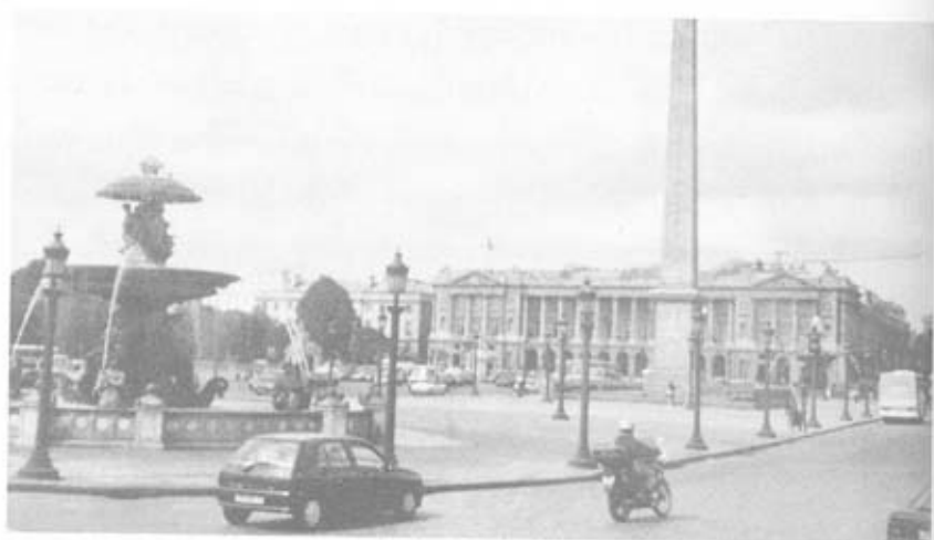
จัตุรัสกองคอร์ด กรุงปารีส

เดินชมและยืนถ่ายรูปกัน บางมุมมองเห็นหอไอเฟลแต่ไกล จึงพอเป็นฉากหลังในการถ่ายรูปได้ด้วย