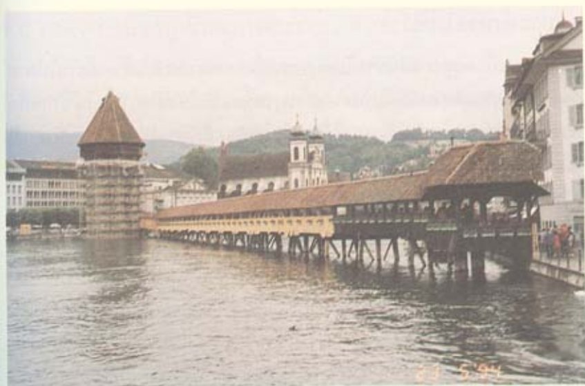
สะพานแห่งความรัก ข้ามทะเลสาบลูเซิร์น