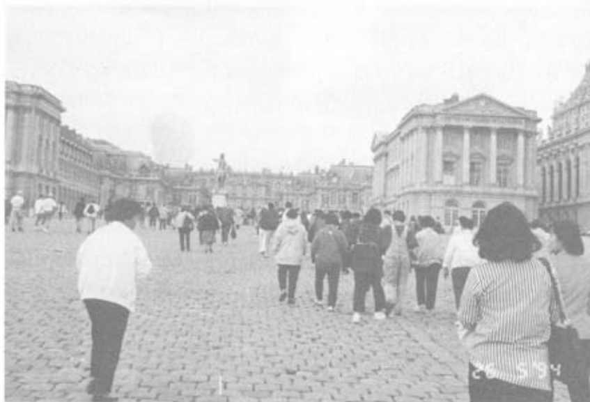
ลานกว้างหน้าพระราชวังแวร์ซายส์