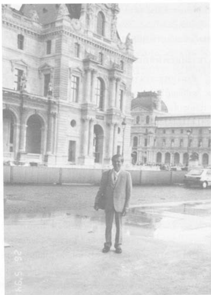
พระราชวังลูฟว์ กรุงปารีส

ภาพโมนาลิซ่าชิ้นใหม่ และเหมือนภาพจริงมาก ได้หลบอยู่ช่วงวันเสาร์-วันอาทิตย์ แล้วเปลี่ยนภาพที่เขียนใหม่แทนไว้ กว่าจะทราบความจริงก็ผ่านไปหลายวัน ผลสุดท้ายก็นำคืนมาได้ ยิ่งไปกว่านั้น ชาวอเมริกันต้องการนำภาพโมนาลิซ่าไปแสดงที่อเมริกาเมื่อ 60 ปีที่แล้ว ต้องมัดจำพิพิธภัณฑ์ลูฟว์ไว้ถึง 100 ล้านดอลลาร์