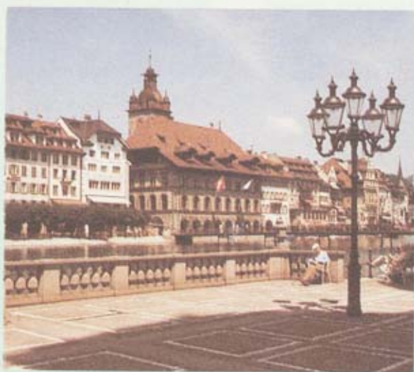
อาคารแบบเก่า ริมทะเลสาบดูเจิน