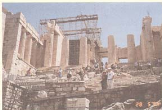
บนอโครโพลิส กลางกรุงเอเธนส์