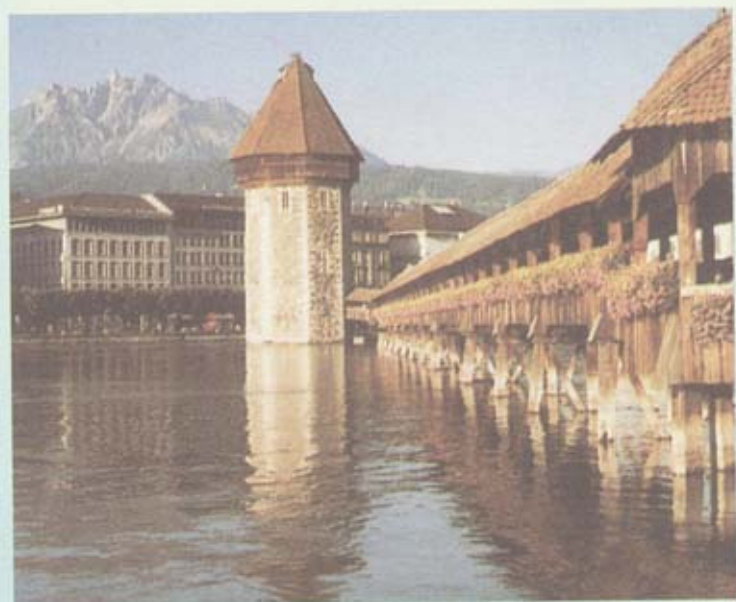
สะพานแห่งความรัก มองเห็นหิมะบนยอดเขาอะดิลชไตน์