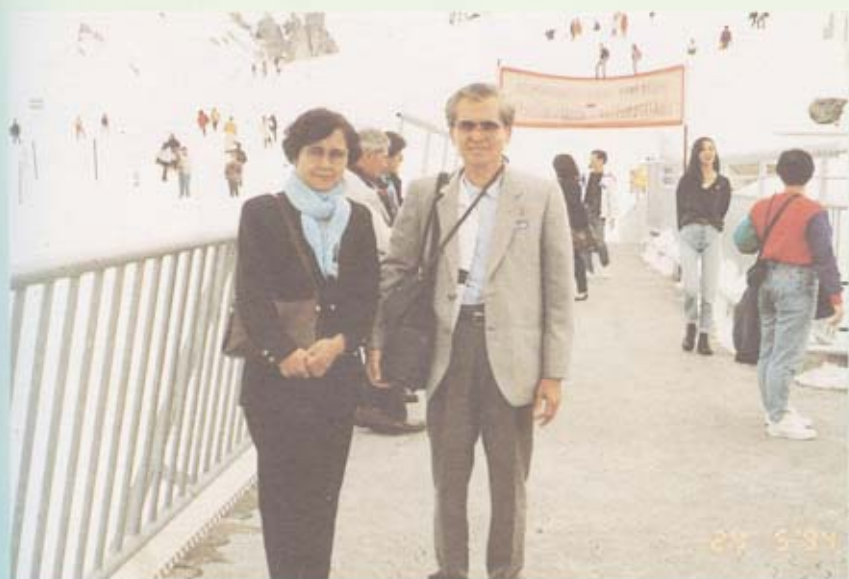
บนยอดเขาทิตลิส มองเห็นคนเล่นสกีและเดินชมหิมะ