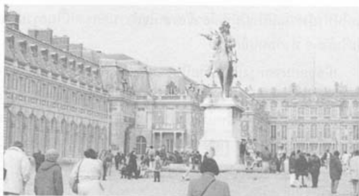
อนุสาวรีย์ พระเจ้าหลุยส์ที่ 14

หลังม้าเด่นสง่าอยู่กลางลานกว้างหน้าพระราชวังแวร์ซายส์ มีคนมายืนถ่ายรูปกันมาก เพราะมีฉากหลังติดอนุสาวรีย์และพระราชวัง ถ่ายรูปมุมไหนก็สวยทั้งนั้น พวกเราต้องรอเข้าชมภายในพระราชวังตอน 14.00 น. เพราะต้องเข้าชมเป็นรอบๆ มีคนรอเข้าชมมากมาย