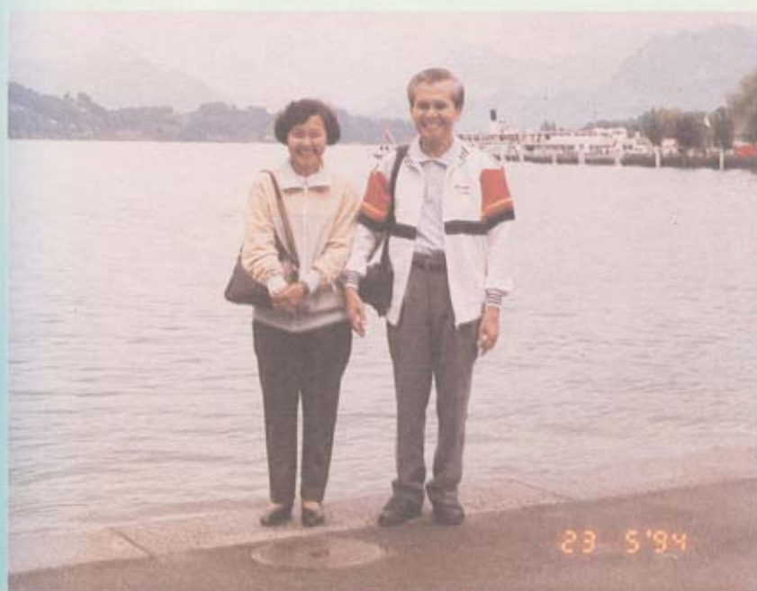
ทะเลสาบลูเซิน น้ำไหลลงมาจากภูเขาที่มองเห็นไกลโพ้น

ลูเซิน ผ่านอาคารบ้านเรือนย่านธุรกิจ ซึ่งส่วนมากปิด ทะเลสาบลูเซินเกิดจากการละลายของหิมะบนยอดเขา เห็นชัดเจนว่าทะเลสาบอยู่กลางหุบเขามองเห็นภูเขาเป็นฉากของทะเลสาบสวยงามมาก ยิ่งในฤดูหนาวจะมองเห็นยอดเขาขาวโพลนด้วยหิมะ ริมทะเลสาบมีอาคารบ้านเรือน เป็นอาคารแบบเก่าที่เขายังรักษาไว้ อาคารบางหลังมีหลังคาเป็นยอดโดม คือ ยอดแหลมขึ้นไป แสดงว่าเมืองลูเซินเป็นเมืองที่เก่าแก่มากานาน ร้านอาหารริมทะเลสาบ มีโต๊ะอาหารหน้าร้านมากมาย มีชาวสวิสสูงอายุ แต่งตัวสวยงามมานั่งทานอาหารและเครื่องดื่มกันมาก มักคุยเทศน์เล่าว่า ชาวสวิสนิยมมาพักผ่อนหย่อนใจด้วยการมานั่งทานอาหารและเครื่องดื่มหน้าร้านและริมฟุตบาทข้างถนนกันในช่วงฤดูร้อน