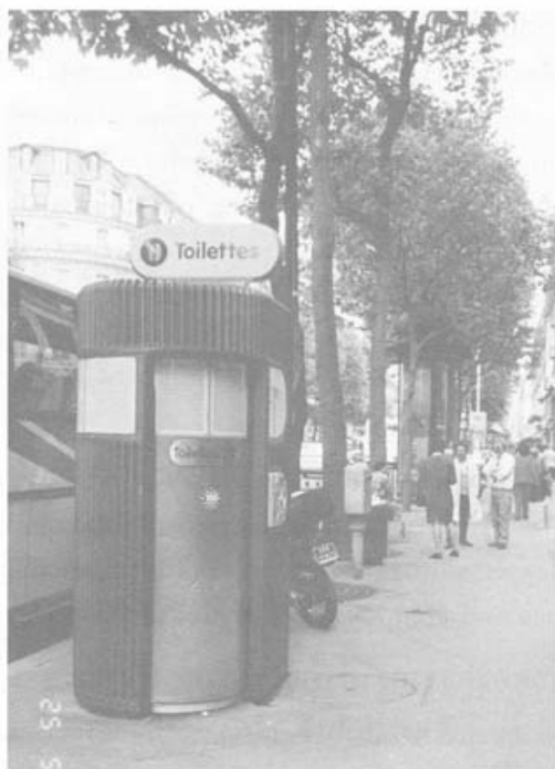
ส้วมสาธารณะ ริมถนนกลางกรุงปารีส

นาที่แล้ว ประตูจะเปิดเอง ถ้าคิดว่า 15 นาทีไม่เสร็จ ก็ต้องออกมาหยอดเหรียญต่อ ดังนั้นถ้าใครจะเข้าส้วมสาธารณะต้องพยายามให้เสร็จภายใน 15 นาที ซึ่งก็มากพอสมควรแล้ว