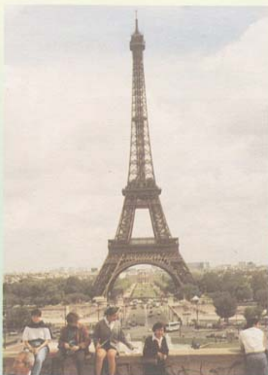
หอไอเฟล กรุงปารีส