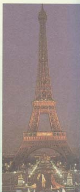
หอไอเฟล ชามค่าคืน