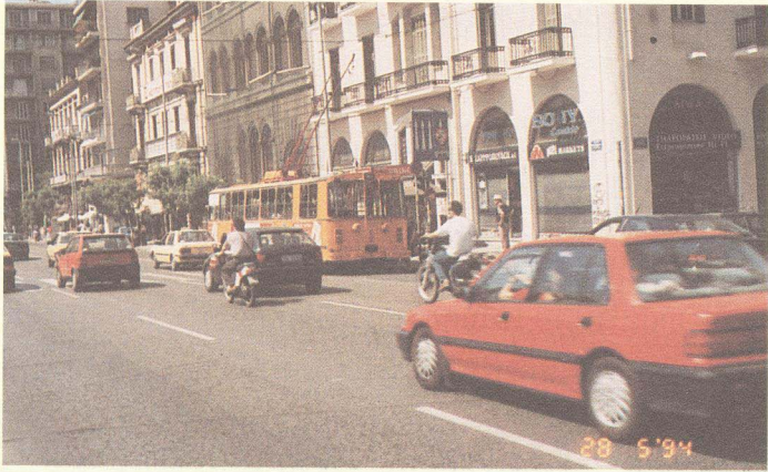
ถนนกลางกรุงเอเธนส์ จะเห็นรถโดยสารไฟฟ้าด้วย

แต่พวกเราก็ได้สัมผัสกรุงเอเธนส์เท่าที่ได้กล่าวมาแล้ว เมื่อกลับถึงโรงแรมที่พัก ก็รับประทานอาหารกลางวันของกรีกอีกเช่นเคย มื้อกลางวันนี้มีเส้นหมี่ ข้าว เนื้อคูน ซึ่งมีรสเลี่ยนๆ เมื่อหิวก็ทานได้ จากนั้นให้เราได้พักผ่อนและเก็บข้าวของลงกระเป๋า เพราะต้องใช้เวลาพอสมควร เนื่องจากมีของมากขึ้น เพราะผ่านมาสยามเมืองสามประเทศแล้ว