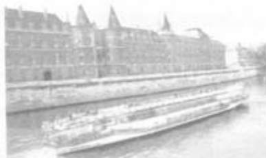
ลงเรือนำเที่ยวในแม่น้ำแซนส์