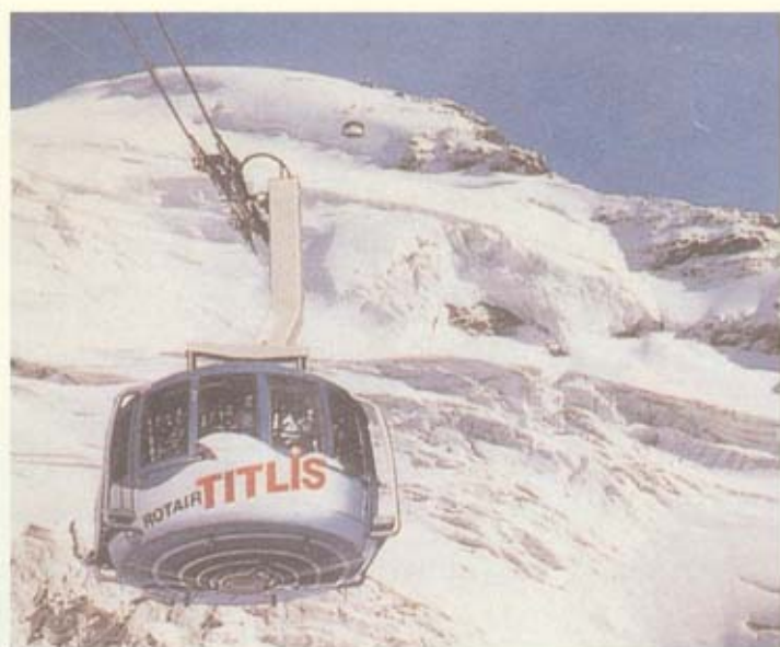
กระเช้าไฟฟ้าขนาดใหญ่ขึ้นเขาทิตลิส