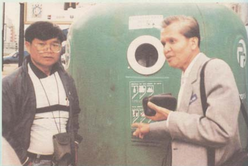
ถังขยะขนาดใหญ่ กลางกรุงปารีส