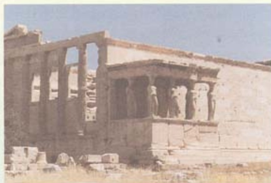
วิหารอีกหลังหนึ่ง บนอโครโพลิส