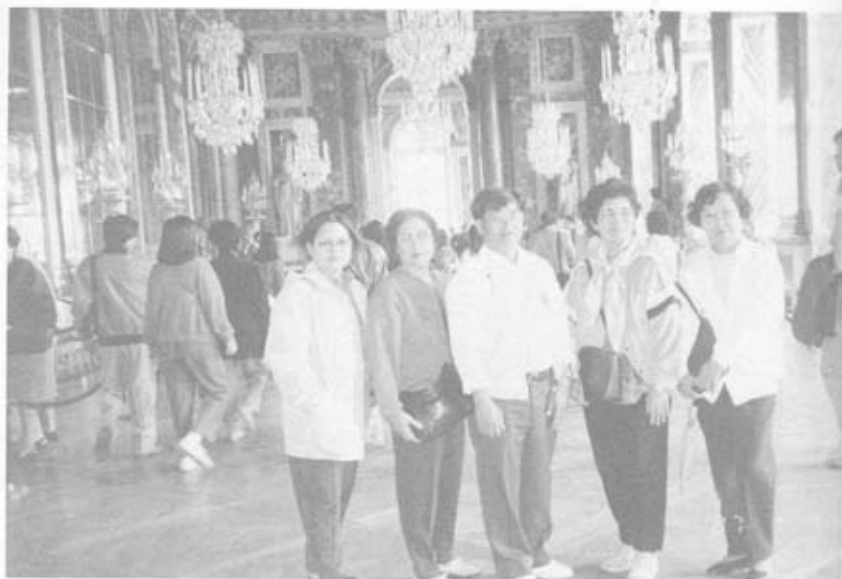
ห้องพระโรงใหญ่ ภายในพระราชวังแวร์ซายส์