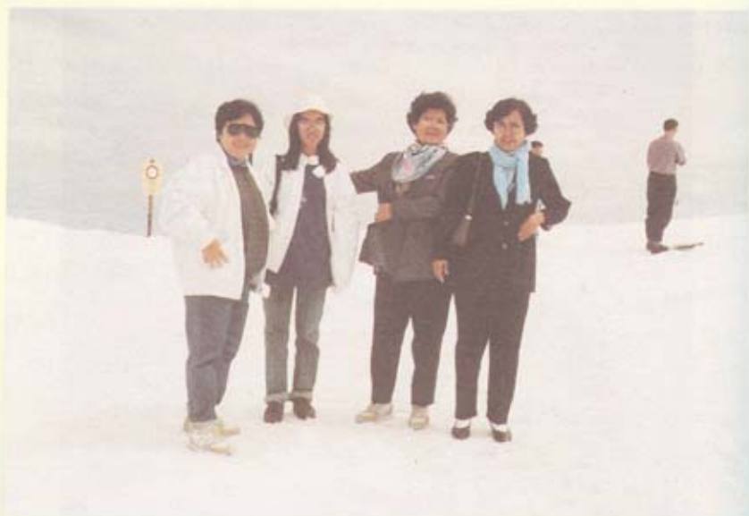
หิมะขาวโพลน บนยอดเขาทิดลิส