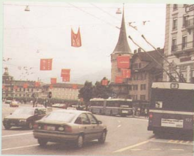
รถประจำทางไฟฟ้า กลางเมืองดูเซ็น

เมื่อพวกเราเดินข้ามไปยังฟากหนึ่งของทะเลสาบแล้ว ก็เดินไปตามถนนและริมทะเลสาบ มีต้นไม้ขนาดใหญ่ร่มรื่นและมีม้านั่งยาวๆ ให้นั่งเล่นได้ ด้วย อากาศริมทะเลสาบดีมาก ไม่ร้อนไม่หนาว กำลังพอดี พวกเราเดินกลับโรงแรมโดยไม่ต้องกลับทางเดิม แต่เดินข้ามสะพานคอนกรีตเสริมเหล็กที่เขาสร้างสำหรับรถยนต์แล่นไปมาได้ และมีฟุตบาทกว้างขวางพอสมควรสำหรับให้คนยืนชมทิวทัศน์ของทะเลสาบ และยืนถ่ายรูปไว้เป็นที่ระลึกได้ด้วย บนสะพานมีรถยนต์แล่นไปมาไม่มากนัก ที่น่าสังเกตคือ มีรถประจำทางไฟฟ้าแล่นไปมาด้วย โดยใช้ไฟฟ้าต่อสายมาจากสายไฟฟ้าข้างบน รถวิ่งไปตามเลนของรถประจำทางคล้ายรถรางของไทยสมัยก่อน แต่ของเขาไม่มีรางเป็นรถยนต์ทั่วๆ ไป และตามป้ายรถประจำทางมีที่หยอดเหรียญเพื่อซื้อตั๋วรถประจำทางด้วย ในกรุงเทพมหานครของเราก็เคยคิดที่จะมีรถยนต์ไฟฟ้าทำรถประจำทาง แต่ก็ไม่มีอะไรก้าวหน้า ถ้ามีได้จะดีมาก เพราะควั่นพิษจากรถยนต์จะได้น้อยลง