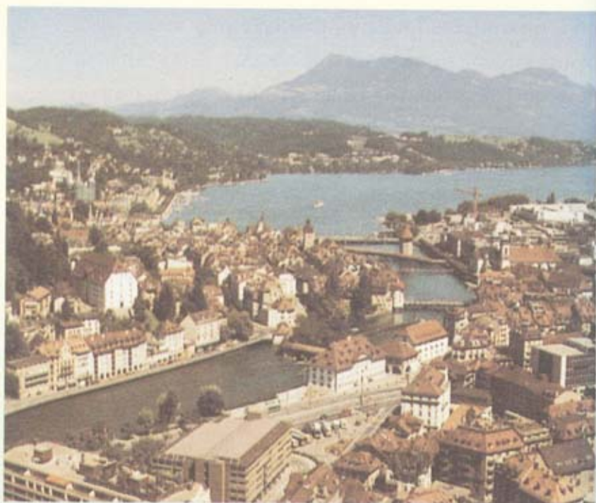
ทิวทัศน์ของทะเลสาบลูเซิน