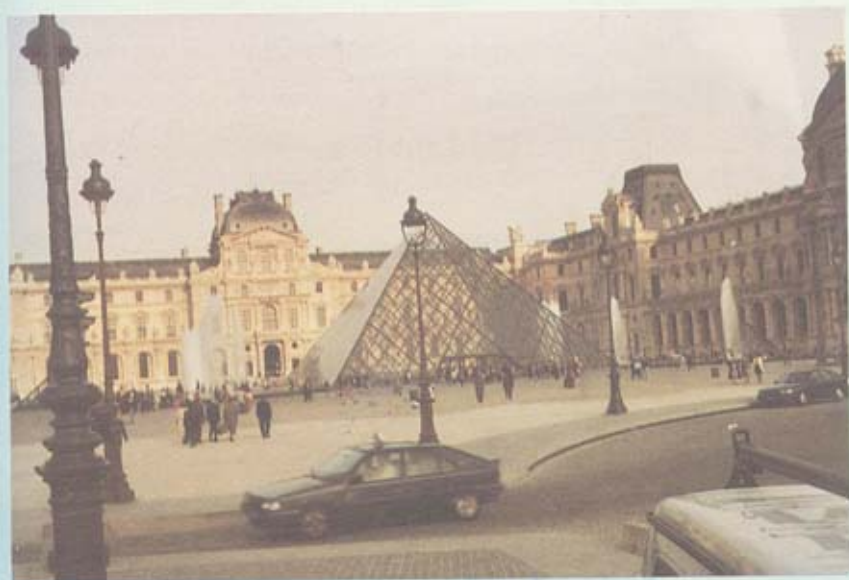
พระราชวังลูฟร์ จะเห็นพีระมิดกระฉก กลางพระราชวัง