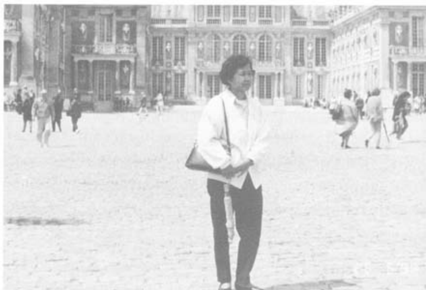
หน้าพระราชวังแวร์ซายส์