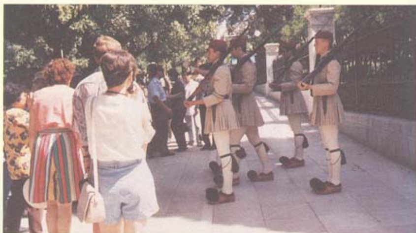
ทหารรักษาการณ์ แต่งตัวแบบทหารกรีกโบราณ

(29 ปีมาแล้ว) ทหารบกได้ทำการปฏิวัติรัฐประหารสำเร็จ และพระเจ้าคอนสแตนตินที่ 2 พยายามโค่นล้มพวกทหารเช่นกัน แต่ไม่สำเร็จ จึงเสด็จไปประทับ ณ กรุงลอนดอนดังกล่าว คณะปฏิวัติได้ประกาศล้มเลิกการมีพระมหากษัตริย์เป็นประมุข เปลี่ยนการปกครองเป็นระบอบสาธารณรัฐ มีประธานาธิบดีเป็นประมุข พระราชวังที่พวกเราไปดูทหารรักษาการณ์ผลัดเปลี่ยนเวรกัน จึงกลายเป็นพระราชวังเก่า และสวนสาธารณะดังกล่าวแล้ว