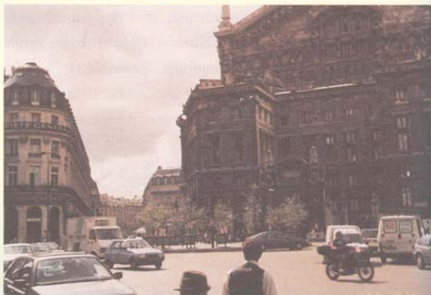
อาคารแบบเก่ากลางกรุงปารีส