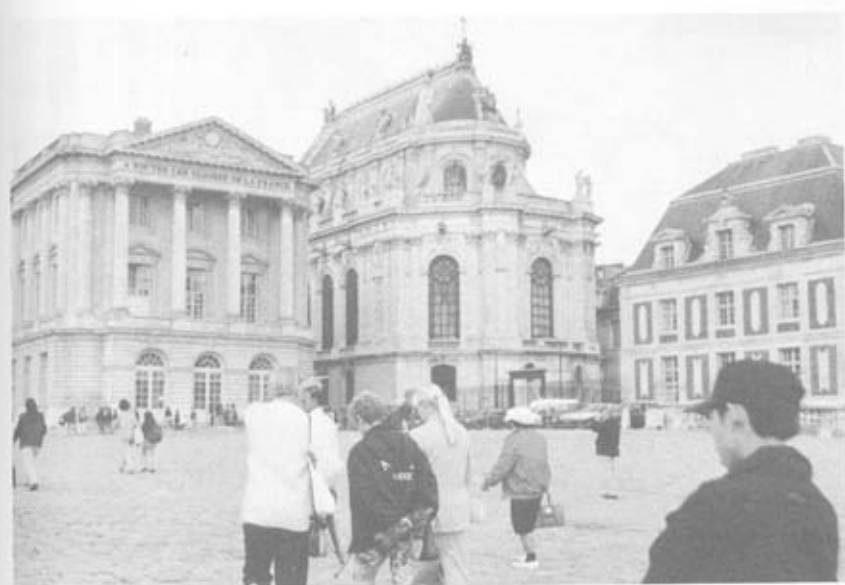
อีกมุมหนึ่งของลานหน้าพระราชวังแวร์ซายส์

คนเสนอให้ทำบ้าง แต่ก็ไม่มีผู้ที่เกี่ยวข้องสนใจทำ นอกจากนี้ในกรุงปารีสยังมี ต้นไม้ร่มรื่นริม 2 ฟากถนนอีกด้วย