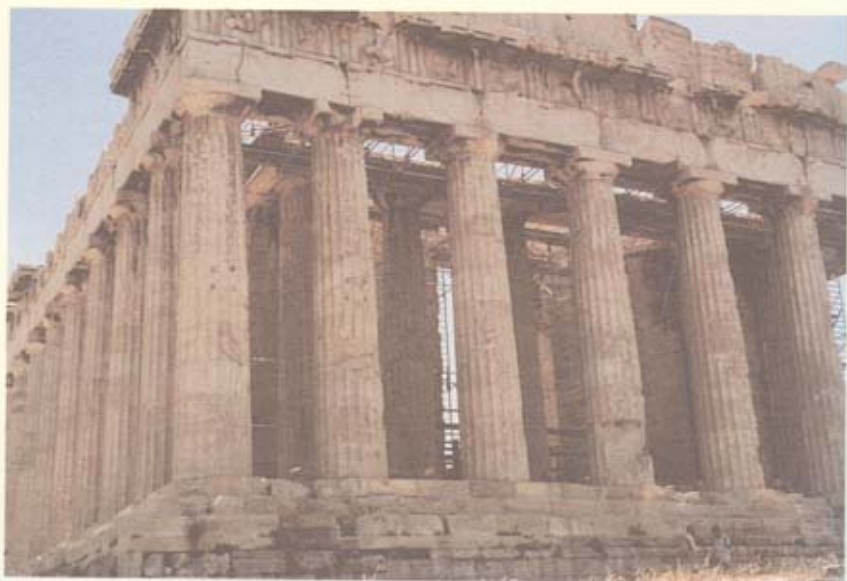
มหาวิหารพาร์เธนอน

ได้เปรียบศัตรูหรือข้าศึกที่มารุกรานและอยู่ในที่ต่ำกว่า ทั้งบนที่สูงนี้ยังมีแหล่งน้ำธรรมชาติอยู่ใต้ดินด้วย จากหลักฐานทางโบราณคดีของกรีก พบว่า มีมนุษย์อาศัยอยู่บนเนินหินลูกนี้มาต่อเนื่องกันมาเรื่อยๆ มิได้ขาด ไม่น้อยกว่า 7 พันปีมาแล้ว จะสังเกตเห็นอโครโพลิสเด่นสง่าอยู่กลางกรุงเอเธนส์ ผ่านไปทางใดของกรุงเอเธนส์ก็จะเห็น ทางรัฐบาลได้ออกกฎหมายห้ามสร้างตึกสูงมาแข่งความเด่นสง่าของอโครโพลิสด้วย