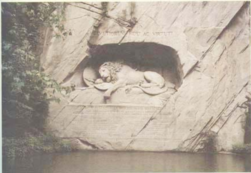
อนุสาวรีย์รูปสิงโต เมืองลูเชิน

รถบัสมาถึงเมืองลูเชินเมื่อเวลา 14.33 น. เข้าพักในโรงแรมโคลบิง พวกเรานำกระเป๋าเข้าห้องพักและเข้าห้องน้ำ นัดพบกันเวลา 15.40 น. เพื่อซักผ้าชมเมืองลูเชินและทะเลสาบ แห่งแรกที่มีคฤหาสน์พาไปชมก็คืออนุสาวรีย์รูปสิงโต ซึ่งอยู่ใกล้ๆโรงแรมที่พัก อนุสาวรีย์รูปสิงโตเป็นรูปแกะสลักหินข้างภูเขา เป็นสัญลักษณ์ความซื่อสัตย์ของทหารสวิสที่ลูเชินสร้างขึ้นเพื่อเป็นเกียรติแก่ทหารสวิสที่กล้าหาญ ซื่อสัตย์ และจงรักภักดีต่อพระเจ้าหลุยส์ที่ 16 ทรงจ้างทหารสวิสเป็นราชองครักษ์ เมื่อพวกกบฏเข้าจับและทำร้ายพระเจ้าหลุยส์ที่ 16 ทหารสวิสได้ต่อสู้ป้องกันจนตัวตายหมดทั้งกองทัพ จึงสร้างอนุสาวรีย์รูปสิงโตไว้ให้เป็นเกียรติ มีนักท่องเที่ยวไปชมกันเรื่อย ๆ