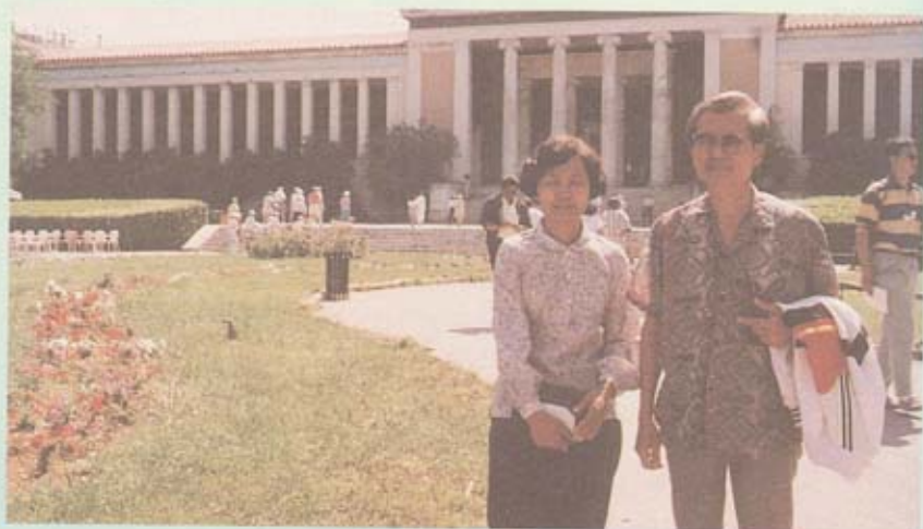
หน้าพิพิธภัณฑสถานแห่งชาติ กรุงเอเธนส์

จุดแรกที่พวกเราได้ชม คือ พิพิธภัณฑสถานแห่งชาติ ลักษณะของพิพิธภัณฑสถานเป็นอาคารที่สร้างขึ้นใหม่ แต่ก็มีอิทธิพลของสถาปัตยกรรมโบราณคือ ใช้เสาแบบไอโอนิก เด่นสง่าอยู่ด้านหน้าของอาคารพิพิธภัณฑสถาน พวกเราได้เข้าชมโบราณวัตถุต่างๆ ภายในพิพิธภัณฑสถาน เสียหายที่เขาห้ามถ่ายภาพจึงไม่มีภาพของโบราณวัตถุมาให้ชม เนื่องจากกรีซเป็นประเทศที่เก่าแก่มาแต่โบราณ ทั้งยังมีนิยายปรัมปรามากมาย จึงมีประติมากรรมแกะสลักหินเป็นรูปเทพเจ้าทั้งแบบลอยตัวและแบบนูนสูง นอกจากนั้นยังมีเครื่องประดับทำด้วยทองคำสวยๆ ทั้งนั้น เครื่องปั้นดินเผาและอาวุธยุทโธปกรณ์ต่างๆ ด้านข้างของพิพิธภัณฑสถานมีประติมากรรมแกะสลักหินเป็นรูปเทพเจ้า ขนาดใหญ่มากมาย