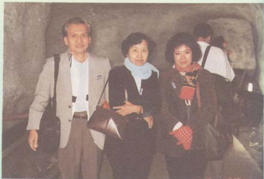
อุโมงค์หิมะ บนยอดเขาทิดลิส อากาศหนาวมาก