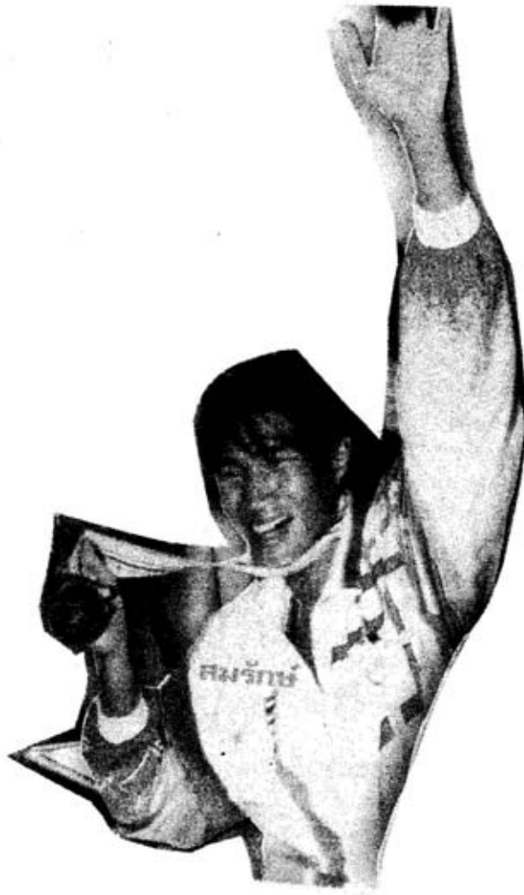
สมรักษ์ คำสิงห์ นักมวยสากลที่ได้เหรียญทอง แอดแลนตา โอลิมปิก 1996

และยังได้เหรียญทองแดงจากการชกในรุ่นของวิชัย ราชานนท์อีกด้วย จึงนับเป็นเกียรติประวัติและประจวบเหมาะแห่งการเฉลิมฉลองปีกาญจนาภิเษกของพระบาทสมเด็จพระเจ้าอยู่หัวโดยแท้