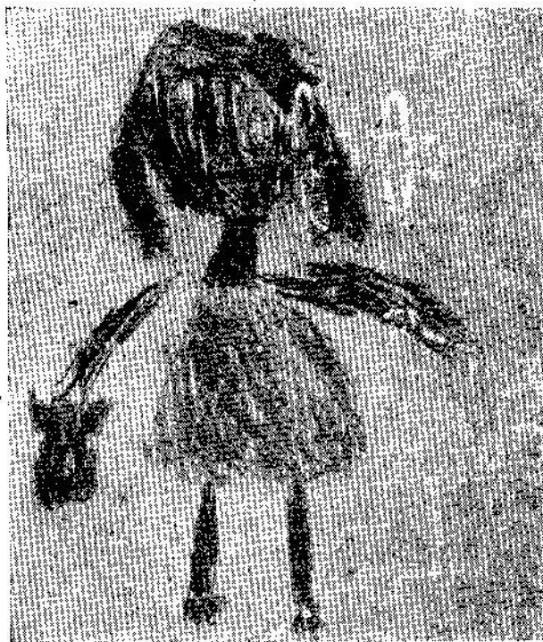
ภาพเขียนของเด็กวัย 4-7 ขวบ