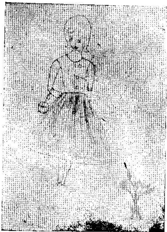
ภาพเขียนของเด็กวัย 9-11 ขวบ