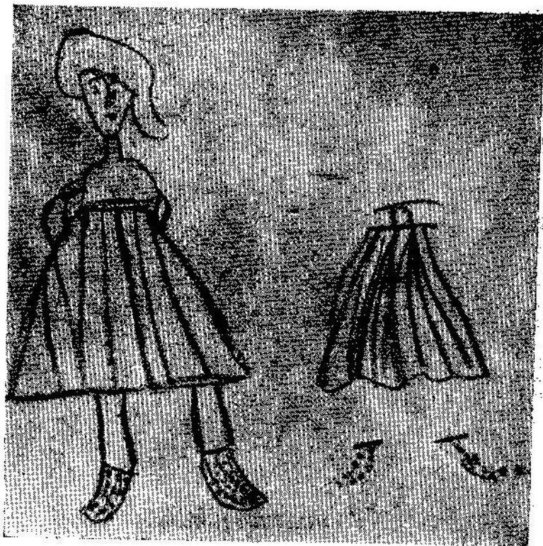
ภาพเขียนของเด็กวัย 7-9 ขวบ