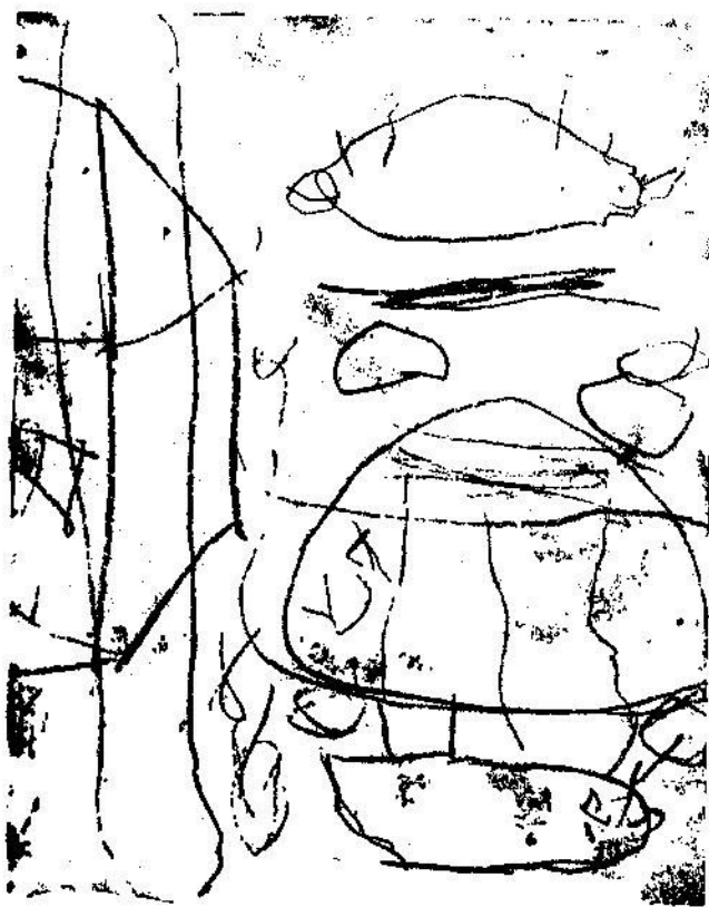
ภาพเขียนของเด็กวัย 2-4 ขวบ