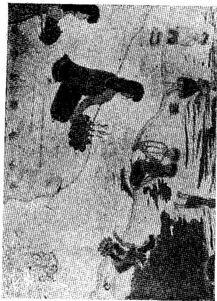
ภาพเขียนของเดวิด 11-13 ขวบ