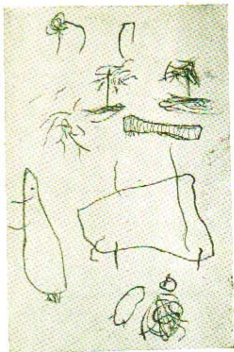
ภาพเขียนของเด็กวัย ๒-๔ ขวบ