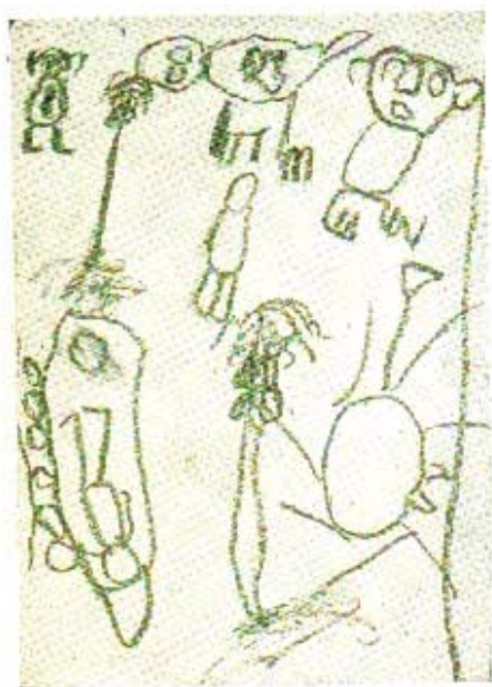
ภาพเขียนของเด็กวัย ๔-๗ ขวบ