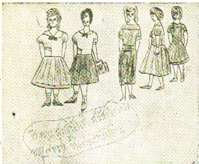
ภาพเขียนของเด็ก วัย ๗-๙ ขวบ