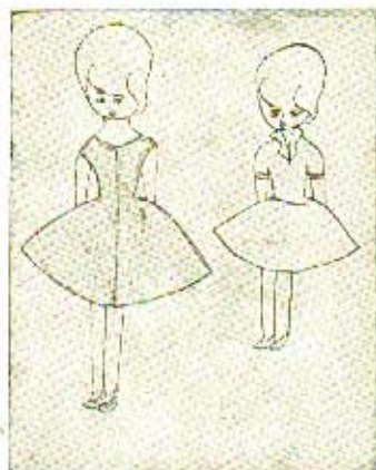
ภาพเขียนของเด็กวัย ๙-๑๑ ขวบ