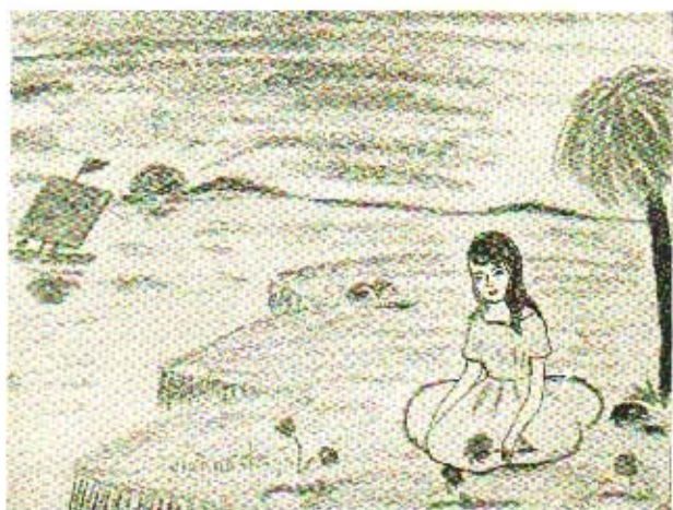
ภาพเขียนของเด็ก วัย ๑๑-๑๓ ขวบ