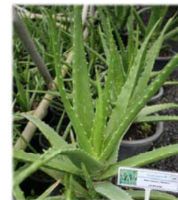
A. indica Royle