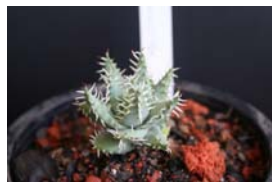
A. erinacea “แคระ”