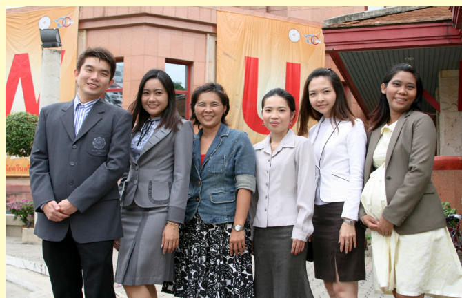
กองบรรณาธิการ