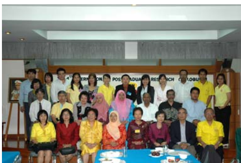
๔) อนุญาตให้ใช้เครื่องมือวิจัย