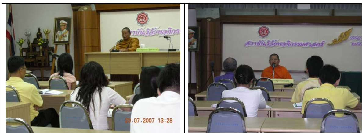
ภาพบรรยายธรรม (ต่อจากหน้า ๑)

๔. ตัวแปรในการทำนายพฤติกรรมมีส่วนร่วมทางการเมืองของหัวหน้าครัวเรือนในองค์การบริหารส่วนตำบล ได้แก่ การรับข่าวสารทางการเมือง การเข้าร่วมกับกลุ่มในท้องถิ่น และสัมพันธภาพทางการเมืองกับเพื่อน สามารถร่วมกันทำนายพฤติกรรมการมีส่วนร่วมทางการเมืองในองค์การบริหารส่วนตำบลได้คิดเป็นร้อยละ ๓๑.๔