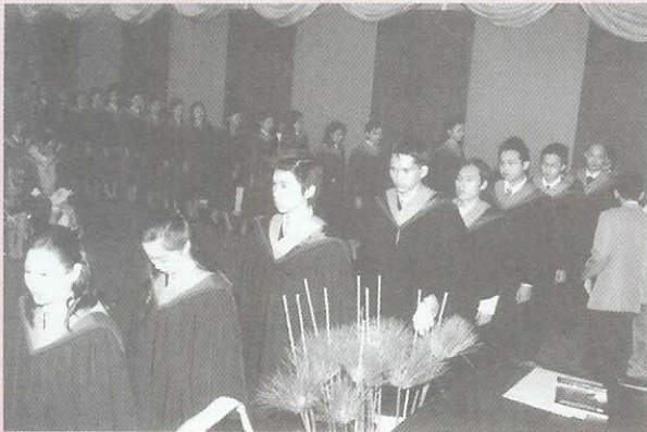
พิธีพระราชทานปริญญาบัตร ประจำปีการศึกษา 2547 30 ธันวาคม 2548 ณ มศว. องครักษ์