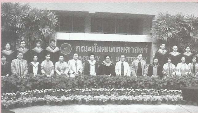
ถ่ายภาพร่วมกับกรรมการผู้ทรงคุณวุฒิ และผู้บริหาร คณะทันตแพทยศาสตร์ วันที่ 23 ธันวาคม 2548