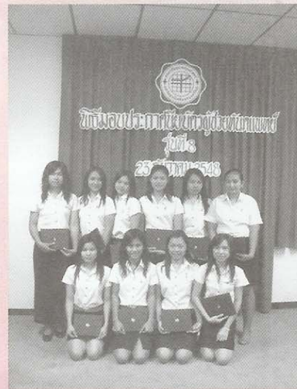
พิธีมอบประกาศนียบัตรผู้ช่วยทันตแพทย์ ประจำปีการศึกษา 2547 (23 ธันวาคม 2548 ณ คณะทันตแพทยศาสตร์) มีผู้สำเร็จการศึกษา จำนวน 13 คน อนาคต สดใส เพราะมีงานทำ กันทุกคน..