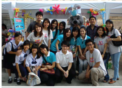
คณะทันตแพทยศาสตร์ ร่วมกับมหาวิทยาลัยศรีนครินทรวิโรฒ จัดงานวันเด็กประจำปี 2553 ณ ลานอโศกพลาซ่า "มือนาคของชาติ เข้าร่วมงานอย่างคึกคัก"...