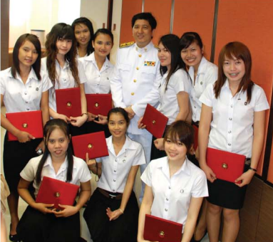
อีกหนึ่งความภาคภูมิใจของคณะทันตแพทยศาสตร์ที่หมอบประกาศนียบัตรผู้ช่วยทันตแพทย์ รุ่นที่ 12 จำนวน 21 ราย เมื่อวันที่ 9 ธันวาคม 2552

วันพุธที่ 9 และ วันจันทร์ที่ 14 ธันวาคม 2552