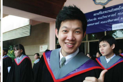
คณาจารย์ บุคลากร ศิษย์เก่า และศิษย์ปัจจุบันขอร่วมแสดงความยินดีกับบัณฑิต เมื่อวันที่ 9 ธันวาคม 2552 ที่ได้สำเร็จการศึกษาระดับปริญญาตรี เป็นรุ่นที่ 9 พร้อมกับนำความรู้ความสามารถที่ได้เรียนมาปรับใช้สังคมและประเทศชาติต่อไป

วันพุธที่ 9 และ วันจันทร์ที่ 14 ธันวาคม 2552