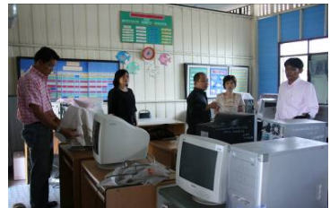
คณะทำงานสำรวจพื้นที่

ชำระค่าไปรษณียากรแล้ว ใบอนุญาตที่ 24/2549 ไปรษณีย์ศรีนครินทรวิโรฒ