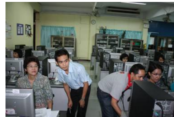
โรงเรียนวัฒนาวิทยาลัย

โครงการ Cyber Education Center สำนักคอมพิวเตอร์ จัดโครงการเผยแพร่ความรู้ด้าน ICT สัญจร เรื่อง “การพัฒนาความรู้และทักษะด้านเทคโนโลยีคอมพิวเตอร์และสารสนเทศ” เมื่อวันที่ 8-9 สิงหาคม 2552 ให้แก่คณาจารย์โรงเรียนวัฒนาวิทยาลัย จำนวน 31 คน และจัดกิจกรรมให้โรงเรียนในเขตจังหวัดสมุทรปราการ จำนวน 4 โรงเรียน ได้แก่ โรงเรียนสาขาสุทธิราชอุปถัมภ์ โรงเรียนบ้านขุนสมุทรไทย โรงเรียนชุมชนวัดสาขลา และ โรงเรียนวัดศรีคงคาราม ในระหว่างวันที่ 10-11 สิงหาคม 2552 มีนักเรียนเข้าอบรมจำนวน 126 คน