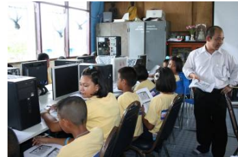
โรงเรียนบ้านขุนสมุทรไทย