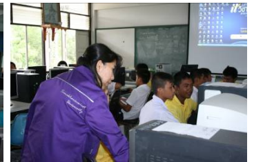
โรงเรียนสาขาสุทธิราชอุปถัมภ์