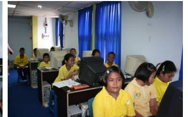
โรงเรียนชุมชนวัดสาขลา