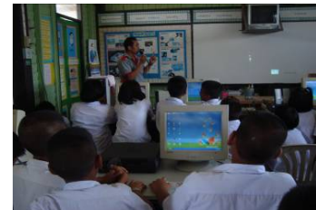
โรงเรียนวัดศรีคงคาราม