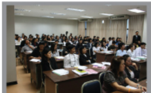
โครงการ Cyber Education Center สำนักคอมพิวเตอร์ ได้จัดโครงการสัมมนาวิชาการเพื่อชุมชน ครั้งที่ 2 เรื่อง "จัดการสื่ออิเล็กทรอนิกส์ด้วยสื่อออนไลน์" ในวันที่ 27 กุมภาพันธ์ 2551 เวลา 8.30-12.00 น. ณ ห้องประชุม 8110 ชั้น 8 อาคารสำนักหอสมุดกลาง มหาวิทยาลัยศรีนครินทรวิโรฒ