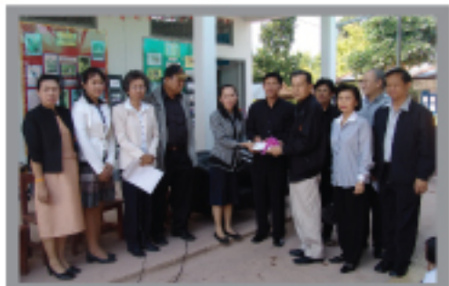
ศ.ดร.วีจุฬ พึ่งเจริญ อธิการบดี มคอ ยริอด้วยกับผู้บริหารมหาวิทยาลัยฯ ส่งมอบห้องสมุดเฉลิมพระเกียรติ โรงเรียนบ้านนาออก สาขามานง จ.ปราบ ยริอด้วยภคินยาภการคือของสคคสคองเรียนการออบแกโรงเรียนดังกล่าว เมื่อวันที่ 26 กุมภาพันธ์ 2551

วันอังคารที่ 18 มีนาคม 2551 อนสม: โครงการพัฒนาศักยภาพนักกีฬาระดับชาติ ณ อาคารศึกษาศาสตร์ มคอ ณ ห้องกิจกรรมสุขภาพ ชั้น 4 The 4th SWU Sport Physical Therapy Workshop: Head Shoulder Arm Region คณะศึกษาศาสตร์ มคอ ออริณ